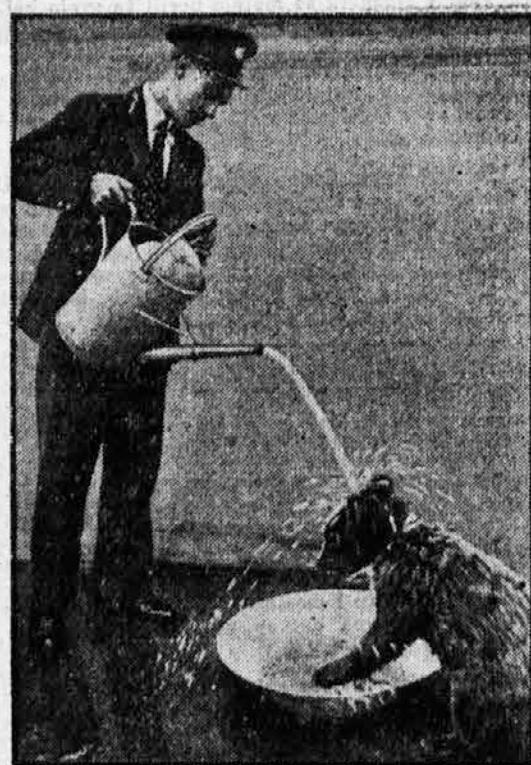
Slika z londonskega živalskega vrta. Pet mesecev starega medveda polivajo vsako jutro z vodo, kar mu očividno zelo ugaja.