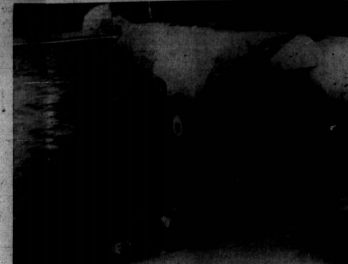
Angleški letalci se vkrcajajo v nekom grškem pristanišču na umiku iz Grške.

z gerla vre, noge ga ne derže, vsa steza, cesta je pijančova, v rov teledi, se v jamo zverne; počasi se spet na noge skomata, oči zakaljene ne poznajo ljudi, z žandarjem se srečata, ta ga šele vkroti, in drugi dan ječa. — Grem pa vendar desetkrat rajši spat, ko bi se ponoči okrog klatil, in vlačil ko meglja brez vetra, ne vedil kam bi se obrnil. V kerčmo ne smes in vso noč pod milim Bogom postopaj, se boš kmalu naveličal; pa tudi drugi dan, poglej ga pijanca, ki je vso noč brez potrebe prečul in prevrskal, poglej ga vlice, blede je kó zid, oči zakaljene komaj odpera, bolj je smerti, le de kose še nima, bolj je smerti ko človeku podoben; ga šiplje, kolje, glava, trebuh ga boli, ne ljubi se mu jesti ne piti, pa, da bi zasramovan ne bil, se sili z jedjo in pijačo, in pije, de se spet vpijan, in meni, da ni fant, ako ni pijan ta dva večera, pa zdravje zapravlja, grob duši in telesi koplje, kmalu oveni, ki bi lahko še sive lase, sive dni doživel. Kje so, matji Krajna! nekdanji čversti sinovi tvoji? Zganje, pijača Satana, vse, vse ti je spasila. Poberi se žganje z dežele in klet na vedno bodi; če te na gnoj vlije, skaziš ga, pobert se z dežele, nisi za rabo, nisi ji v prid, poberi se. Pijanci vi dozorjeni! ki ure skorej ni trezne za vas, kleti vas ne smem, Jezus prepove, pa