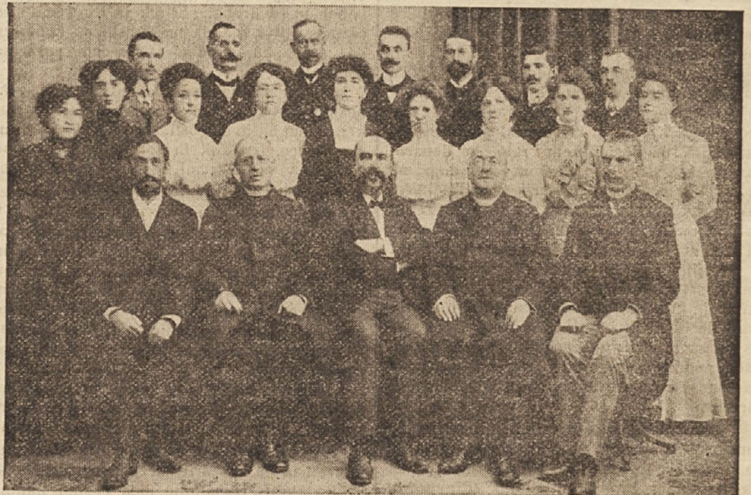
Ravnateljstvo in uradništvo ob 10 letnem obstoju Vzajemne zavarovalnice.

Rešitve je poslati v pravilno frankirani kuverti kot pismo na naslov: Uredništvo »Naše moči«, Ljubljana, Vzajemna zavarovalnica, in to najkasneje do 31. avgusta t. l. Premalo frankirana pisma romajo v koš.