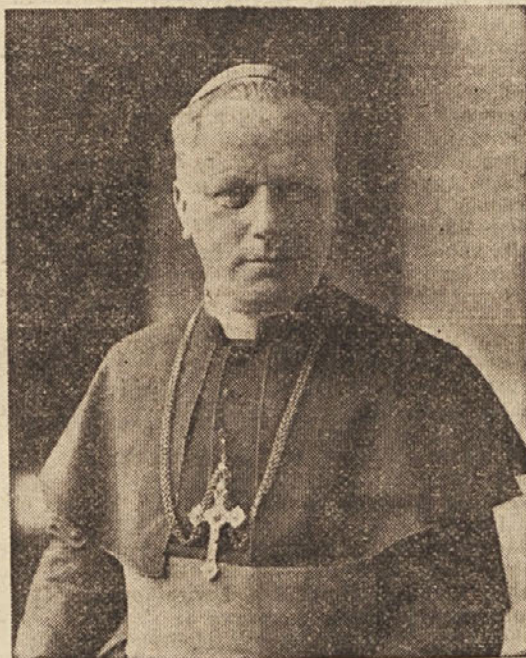
Dr. Gregorij Rožman škof ljubljanski

Drzno se je marsikomu zdelo, ko so pred 40 leti uvidevni možje začeli z domačo zavarovalnico. Da so imeli prav, dokazuje štirideset- letno delovanje zavoda. Zdrav na- rod, četudi majhen, bo vedno sku- šal hraniti denar in premoženje doma, da pride njemu samemu v korist in ne gre med tujce in njihov kapital množi. — Zdrav narod bo vedno v vzajemnosti samemu sebi pomagal.