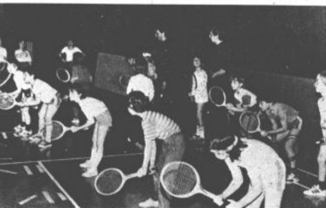
Iz množice mladih bodo dobili kakovostne tekmovalce (VOS)

Teniški klub so v Titovem Velenju ustanovili pred 11 leti, prva igrišča pa so zgradili pred tremi leti. Takrat je bilo v klubu približno 100 članov. Igrišča so zgradili udarniško in v obdobju od leta 1980 do danes so opravili približno 10 tisoč prostovoljnih delovnih ur. Pri gradnji igrišč so jim pomagale tudi delovne organizacije, še zlasti je bila neprecenljiva pomoč Rudnika lignita Velenje. Najprej so nadvse zagnani ljubitelji tenisa zgradili ob jezeru