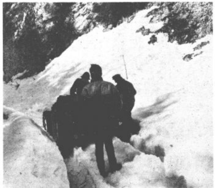
Tudi traktor ni bil kos visokemu snegu