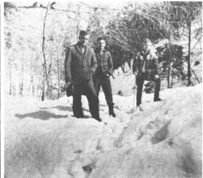
Na vrhu enega od snežnih plazov