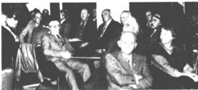
Med skupščino občinske borčevske organizacije

Člani turističnega društva si bodo med drugim v tem letu prizadevali, da čim prej izdamo turistični prospekt, sami pa bodo izdali turistično zanimivo razglednico. Še naprej bodo organizirali tekmovanja za najbolj urejen kraj. Tudi letos bodo pripravili številna predavanja, tesneje pa bodo sodelovali tudi z »zeleznimi stražami«, ki zelo uspešno delujejo na večini osnovnih šol. Tudi letos bodo kot načrtovali pripravili zadnje dni avgusta, turistični teden. Vanj se bodo vključile vse gostinske in turistične organizacije, pa tudi trgovine. Posebej naj poudarimo, da so si v program zastavili tudi organizacijo pustnega karnevala 1987. S pripravami bodo, kot načrtujejo, pričeli že novembra in decembra. Seveda pa imajo člani Turističnega društva v programu še številne naloge s katerimi bodo skušali popestrili turistično ponudbo Saleške doline. (mz)