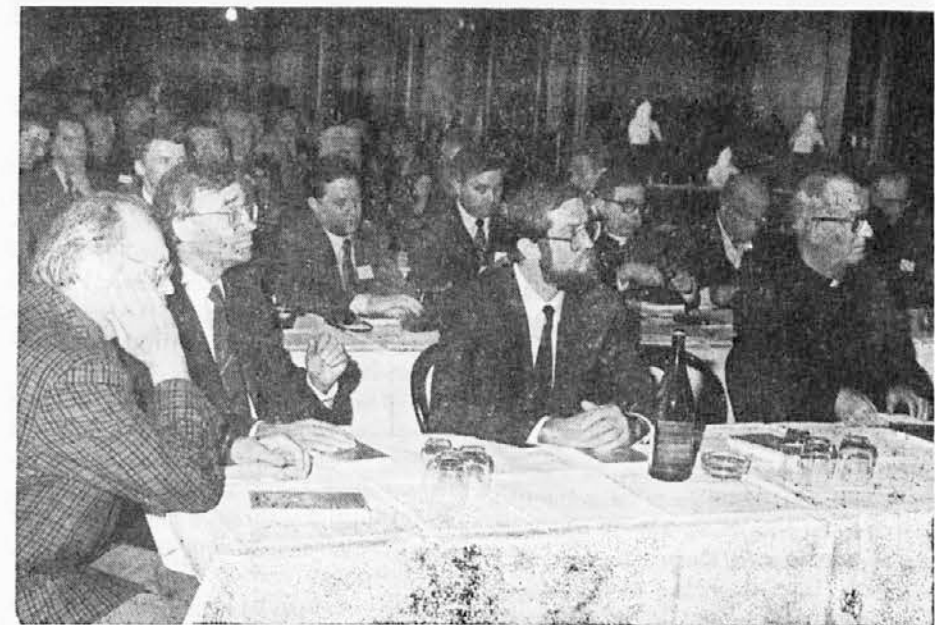
Pri odprtju srečanja urednikov katoliških tednikov v Ljubljani. V sredi predsednik vlade L. Peterle, ob njem nadškof Al. Suštar

Ta je svoj referat naslovil prav na glav-