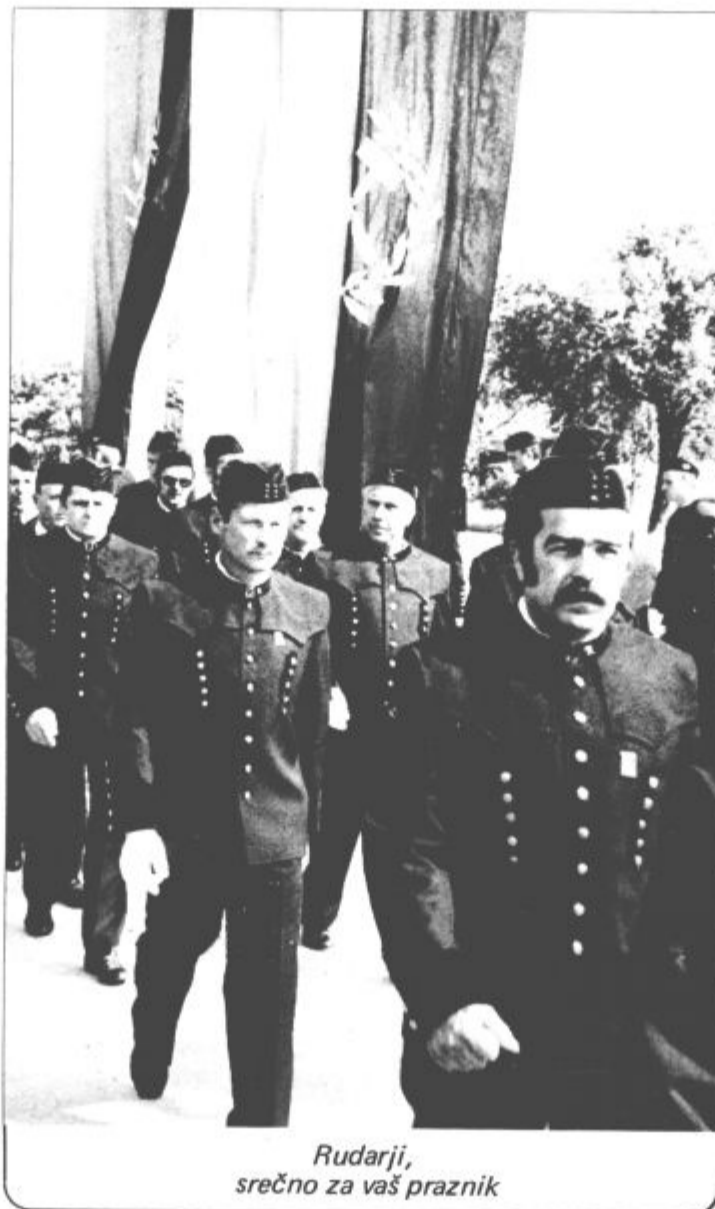
Rudarji, srečno za vaš praznik

Slovesnosti ob pobratenju so udeležili tudi predstavniki občinskih organizacij vseh občin.