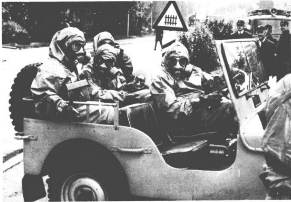
Izvidniške radiološko-biokemične enote so sporočile, da „sovražnik“ ni napadel s kemičnimi sredstvi