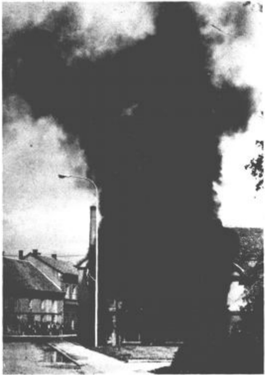
Kmalu po napadu „sovražnikovih“ letal so Havkejevo hišo zajeli ognjeni zublji