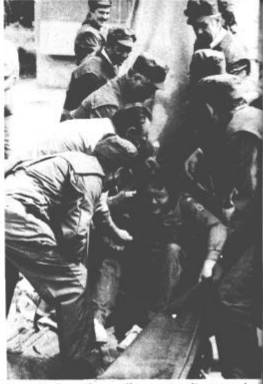
Iz poškodovanih zgradb so reševali stanovalce s pomočjo drsalnih prtov