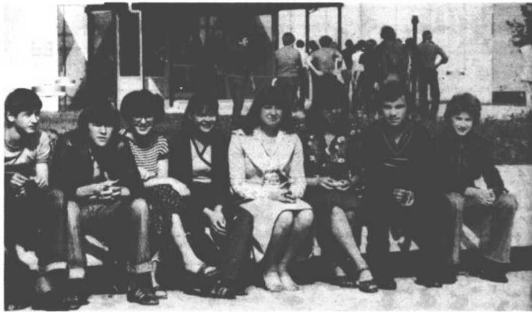
V šolskem letu 1977/78 je obiskovalo rudarski šolski center kar 2250 slušateljev, pred dvajsetimi leti pa le 102 učenca.