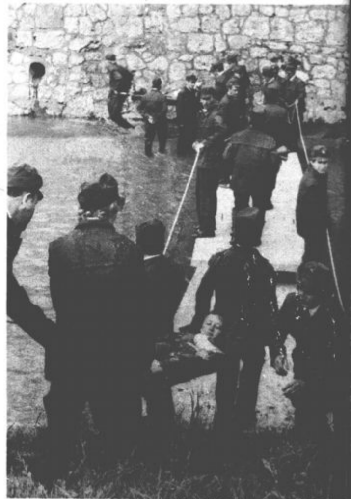
Prek mostu, ki ga je hitro postavila posebna tehnična enota, „ranjene“ stanovalce nosili v zasilno bolnišnico