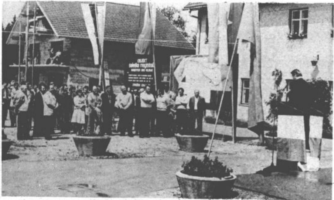
Otvoritvena slovesnost pred združenim domom

Z armirano-betonskimi montažnimi konstrukcijami „Vemont“, tovrstno proizvodnjo so vpeljali leta 1974, so doslej zgradili po Jugoslaviji že več kot 200.000 m2 raznih objektov.