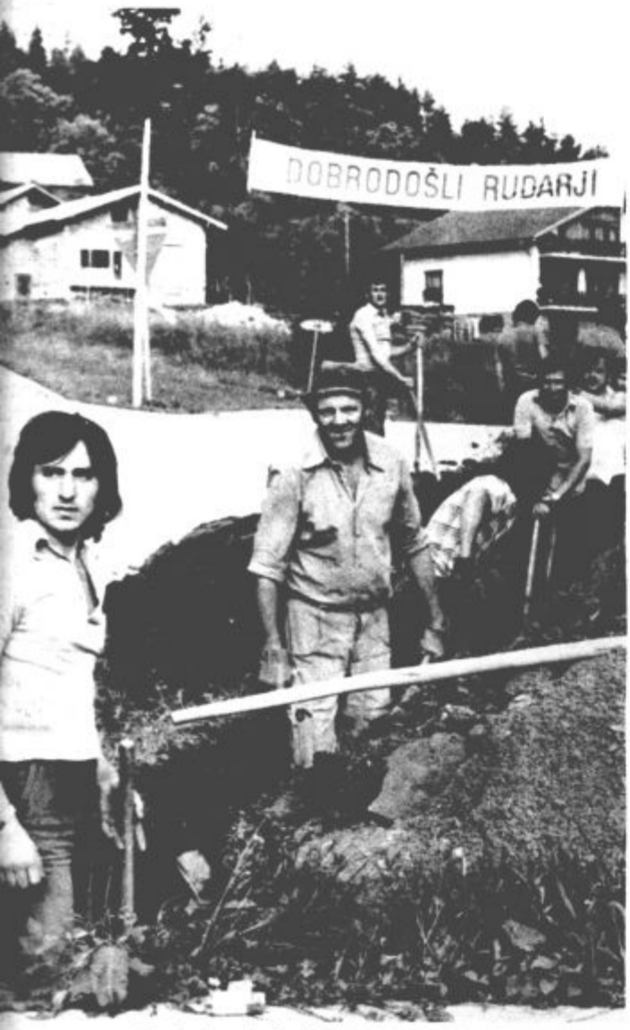
Rudarjem je šlo delo dobro od rok