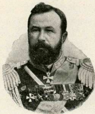
General Kuropatkin, vrhovni poveljnik mandžurske armade.

Japonci nameravajo napasti tudi Niučvang ob izlivu reke Liao, ki je zdaj v ruski oblasti. Odtod bi prodirali proti Mukdenu v Mandžuriji.