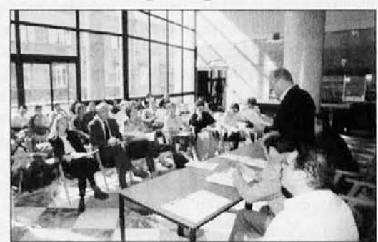
Posnetek s predstavitve