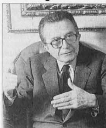
Bodo lisjaka dali v lisice?...

Proces je vzbudil zanimanje po vsem svetu: sledi mu okoli 300 časnikarjev in 60 TV hiš. Andreottiju očitajo, da je osebno podpiral nesporno