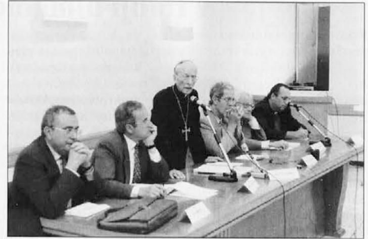
Predavateljska miza med posegom kard. Ersilia Toninija