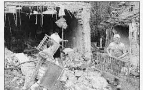
Vojna v Bosni je predvsem tragedija beguncev

V času, ko to pišemo, v New Yorku v ZDA še vedno razpravljajo ministri vseh treh držav, ki so vpletene v vojno v Bosni: srbski minister Milan Milutinović, hrvaški zunanji minister Mate Granić in bosanski kolega obeh Muhamad Sačirbegović ali