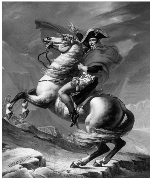
Jacques-Louis David, Napoleon na prelazu Sveti Bernard , 1801

dujočega se realizma, ki ga je čedalje bolj prevzemala svežina slikarskega pristopa alla prima . 8 Pozicija “graditelja mostov” med oblikotvornimi in stilnimi okolji – klasicizmom, romantiko in realizmom – mu je omogočala, da je združeval najboljše “staro” z zanosno slutenim “novim”. V uspelih delih je eksemplarično povzel, če že ne celotnega duhovnega prizadevanja romantičnega obdobja,