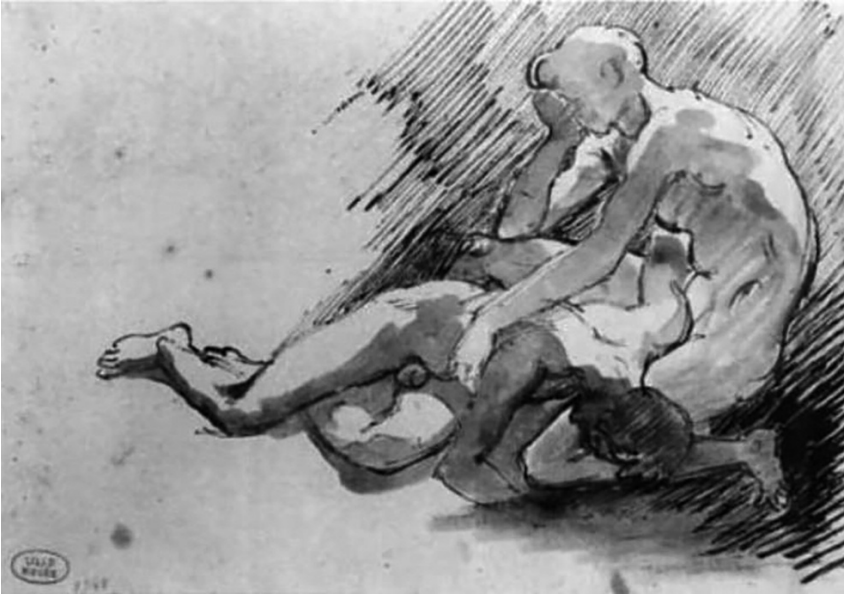
Théodore Géricault, skica za Splav Meduze