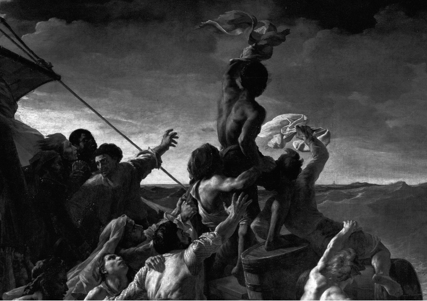
Izrez Splava Meduze

trije vznemirjeno gledajo mahajočega, četrti, ki je obrnjen k njim, pa z roko kaže proti ladji, komaj vidni piki na obzorju – najverjetneje zato, ker ta trojica ladje še ni uzrla. Rekel bi, da je na Splavu Meduze torej prikazan trenutek uzrtja oziroma trenutek zelo kmalu po njem, ko ladje še niso uzrli vsi, niti tisti ne, ki na splavu stojijo povsem blizu brodolomcu, ki jo je uzrl.