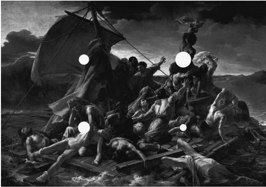
Štiritočkovni kompozicijski model Splava Meduze

pravokotnicama iz oglišč A in C. Pri tem kompozicijska moč točk upada od najmočnejše prve proti najmanj intenzivni četrti.