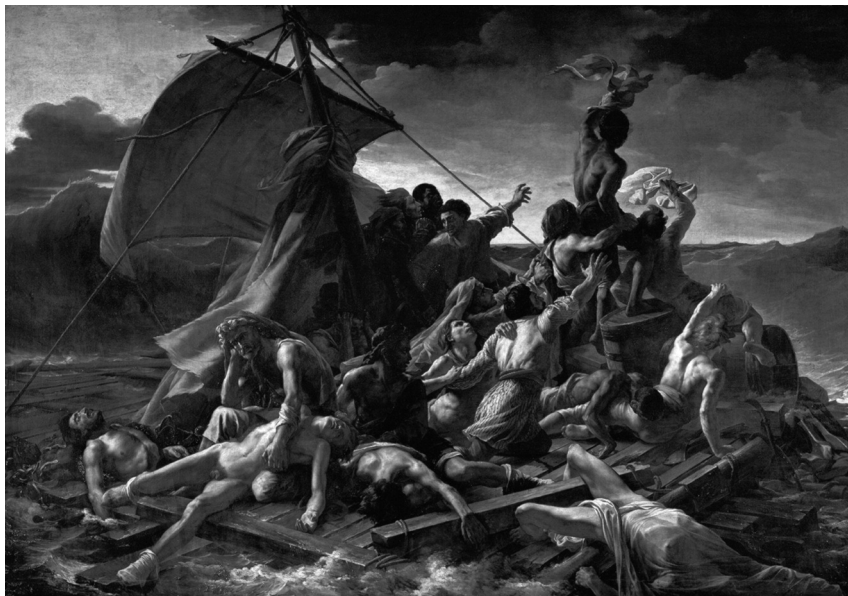
Splav Meduze , 1818/1819, olje na platnu, 491 x 716 cm, Pariz, Musée du Louvre

plamen. Dva, ki sta pozneje napisala poročilo o tej preizkušnji, sta ugotovila, da je bila njihova rešitev resničen čudež in da je bila navzočnost božjega prsta pri tem dogodku neizpodbitna.