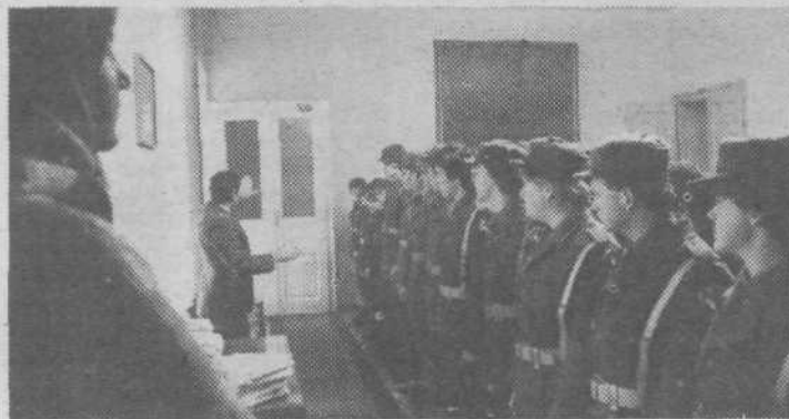
Svečana izjava novih članov enot teritorialne obrambe