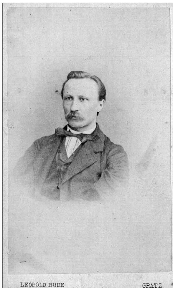
Dr. Benjamin Ipavec (foto Leopold Bude, 1863) (Kartografska in slikovna zbirka NUK).

Stritarjevo kantato »Na Prešernovem domu 15. septembra 1872« je uglasbil dr. Benjamin Ipavec (kantata za zbor, četverospjev, tenor- in bariton solo). Izvedel jo je pevski zbor ljubljanske čitalnice.