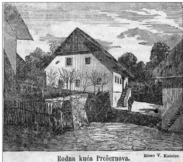
Rodna kuća Prešernova.

Josip Jurčič je ugotavljal, da je Prešernov genius Slovence dvignil iz potrnosti in obupa, v katera so padli med tisočletno materialno in duševno sužnostjo. Slovenski jezik je veljal za jezik hlapcev, sramoval se ga je vsakdo, ki se mu je uspelo povzpeti na družbeni lestvici. Na temnem nebu slovenskega narodnega življenja so vstajali posamezni svetli duho-