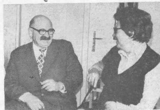
»Pa rekel sem vam, da bomo v Pirničah prvi,« se smehlja Brko