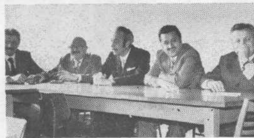
Štab je zasedal ves dan in trenutki sprostitve so bili zares dobrodošli...