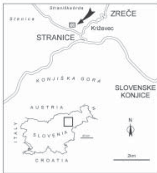
Sl. 1. Položaj najdišča zgornjekrednih fosilov pri Stranicah

Zanimivo je dejstvo, da ostali navedeni raziskovalci razen Redlicha (1901) iz krednih skladov blizu Stranic, sploh ne ome-