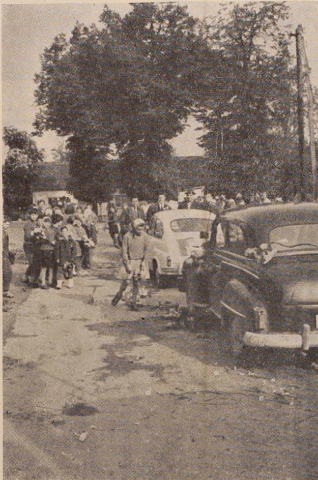
Tako kot na Tišini je bilo povsodi: cvetje, cvetje...