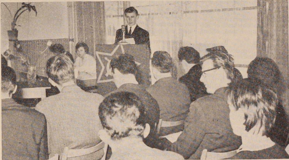
S posvetovanja učiteljsčnikov

jim pripravili svečan sprejem. In štafeta mladosti teče dalje, z njo pa gredo naši pozdravi, čestitke in najboljše želje dragemu Titu ob njegovem rojstnem dnevu