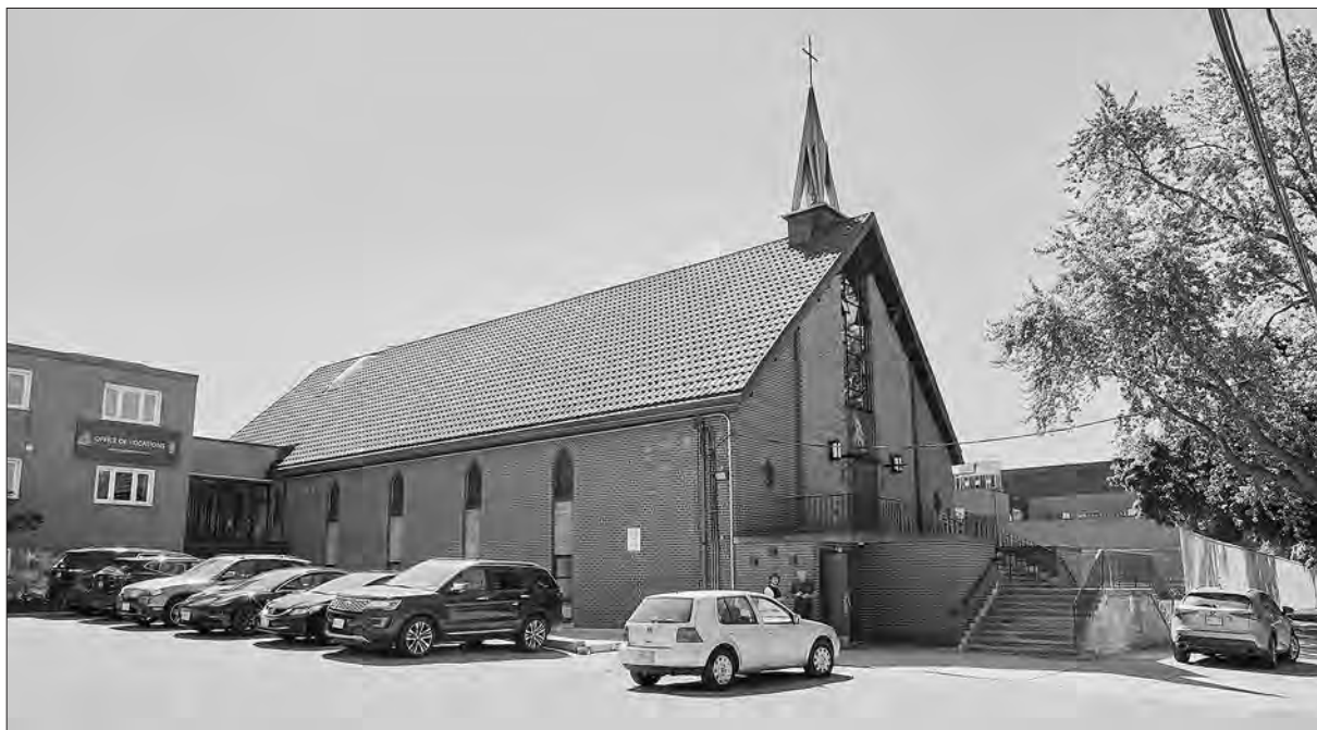
Slovenska cerkev Marije Pomagaj v Torontu.