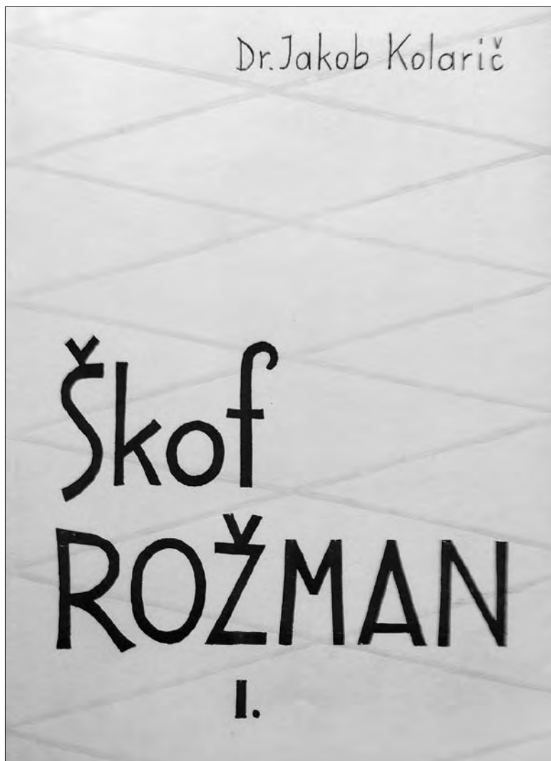
Naslovna stran prvega zvezka Rožmanove biografije.

ki so škofa Rožmana poznali in je od njih dobival gradivo iz prve roke, čeprav je bila vrsta laikov in duhovnikov, tudi med izseljenci, prepričana, da čas za pisanje škofove biografije še ni bil primeren. 40 Tik pred izidom prvega zvezka je za Ameriško domovino pripravil predstavitev nastajanja ideje o zbiranju gradiva in pripravi objave ter razlogih za takšno odločitev. 41 Kot zapiše v uvodu k prvemu zvezku, »se je dela lotil na pobudo slovenskih duhovnikov v Severni Ameriki«. 42 Med njimi je imel vodilno vlogo Ju-