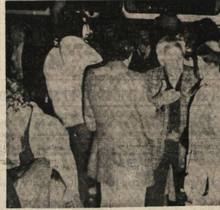
Zavzeto pripovedovanje izletnikov ob povratku v Trst

Protresljivo obujanje tragičnih trenutkov