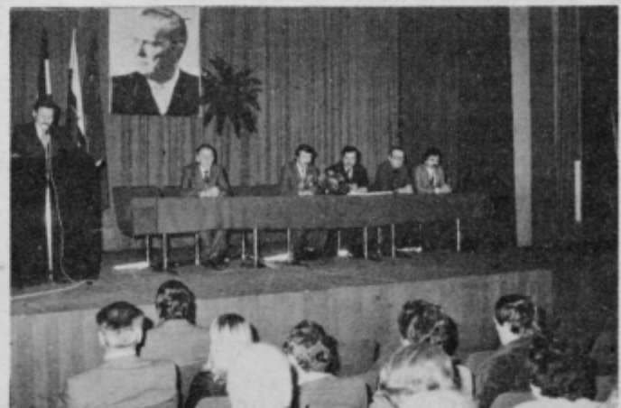
Spominska slovesnost ob 70-letnici rojstva Edvarda Kardelja

Nadalje je bilo v razpravi opozorjeno na težave, ki jih bodo omenjeni ukrepi pogojevali predvsem na nerazvitih območ-