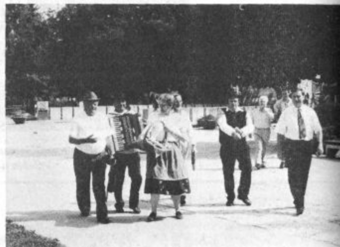
Izvirni in veseli so bili predstavniki Dobrovnik