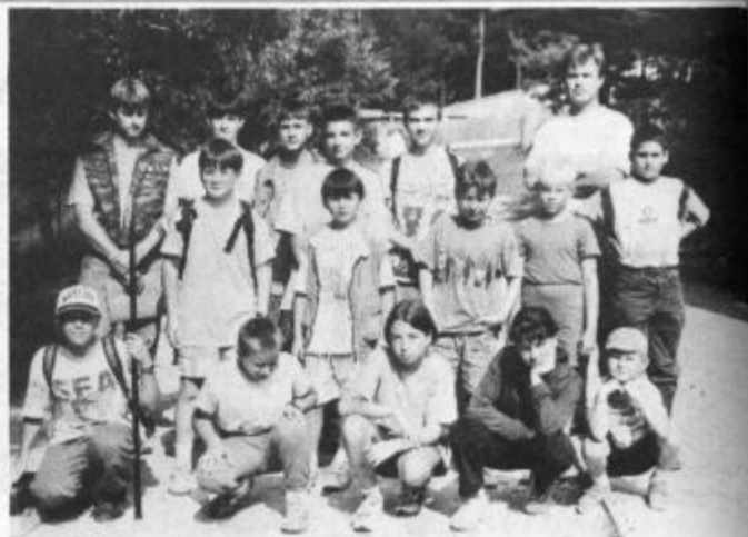
Za spomin skupnina fotografija