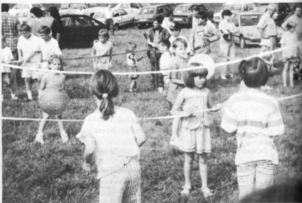
Za najmlajše so pripravili športno delavnico. Gre za akcijo slovenske športne unije, s katero želijo v različne športne dejavnosti pritegniti čim več predšolskih otrok.