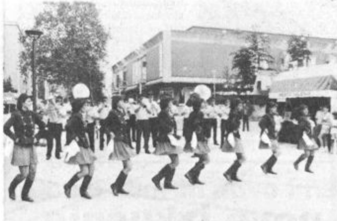
Udeležence so pozdravili šoštanjski godbeniki z mažoretkami