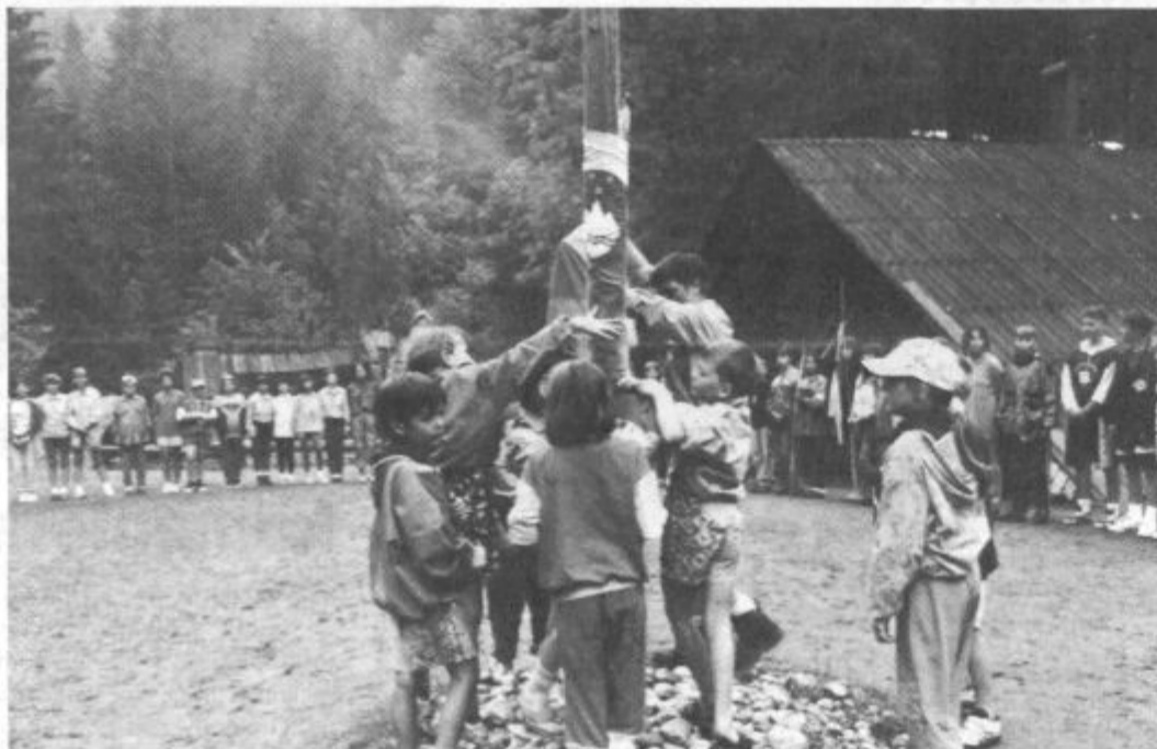
Ko se prebudi jutro, taborniki dvignejo zastavo. Ta v Ribnem plapola že od začetka meseca.

V teh dneh je tam že druga skupina tabornikov iz Velenja. Kako se imajo, kaj vse počnejo, pa vam bomo razkrili v reportaži, ki jo pripravljamo za naslednjo številko Našega časa.