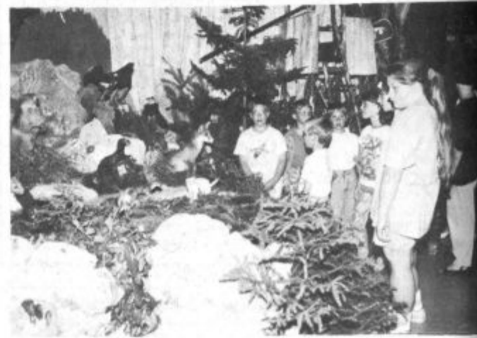
Ob planinski in lovski razstavi so posebej uživali najmlajši

V Škalah tekmovalci kar iz desetih krajevnih skupnosti