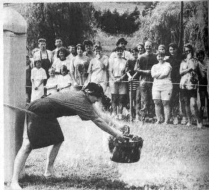
V pripeki je bilo "lovljenje" vode še najbolj dobrodošlo

Vlečenje vrvi je stalnica te prreditve, prav toliko tekmovalne vneme so ekipe namenile tudi ostalim igram - sestavljanju kmečkoga voza, lovljenju jabolk v kadi, sestavljanju slike Rečice, lovljenju vode, zabijanju žeblicev v hlod z obeh strani (hlod je bilo treba za tem še prežagati) in tekmovanju s samokolnico. Največkrat doslej so zmagali tekmovalci in tekmovalke Pobrežij in tudi tokrat so bili najbolj pripravljeni in najbolj zavzeti. Za njimi so se uvrstile ekipe Rečice, Spodnje Rečice, Poljan in Dol Suhe, prijetno popoldne pa se je nadaljevalo v prijeten večer in lepo noč.