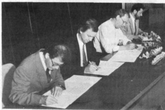
S pristopom Inštituta Jožefa Stefana med ustanovitelje Erica je Velenje dobilo prvi inštitut.