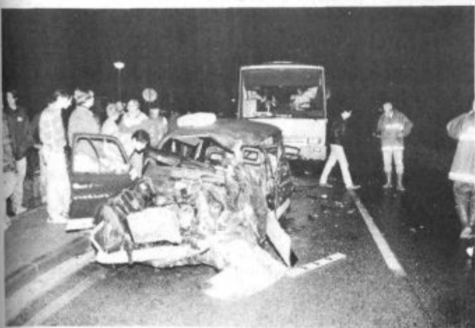
Poletje, vročina, dopusti, počitnice, sproščenost, žeja, veselje, prireditve... Naj to ne vpliva na vašo zbranost med vožnjo, da bo takih prizorov in črnih statistik čim manj.