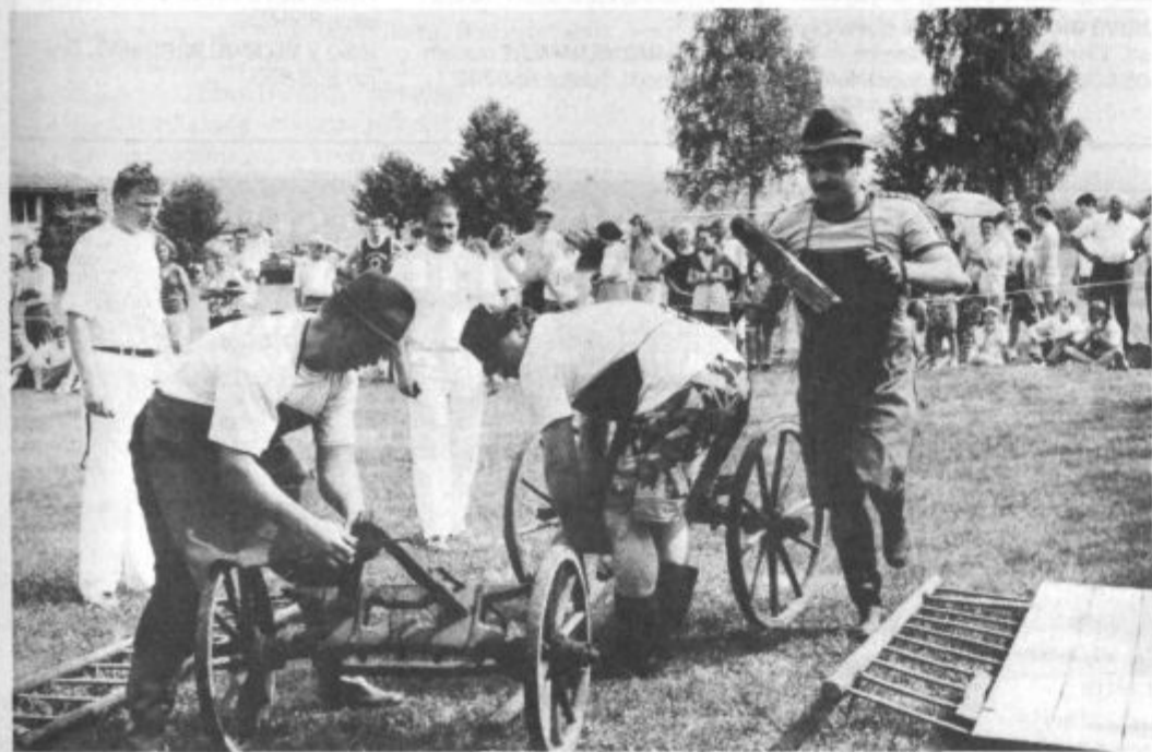
Voz res ni bil velik, "delov" pa je imel veliko