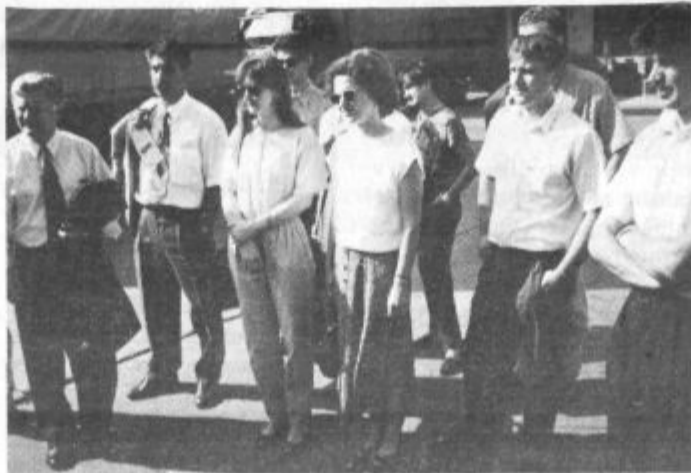
Slušatelji V. Poslovodne šole Gorenje so si med strokovno ekskurzijo na Dunaju ogledali tudi proizvodnjo v tovarni Henkel.