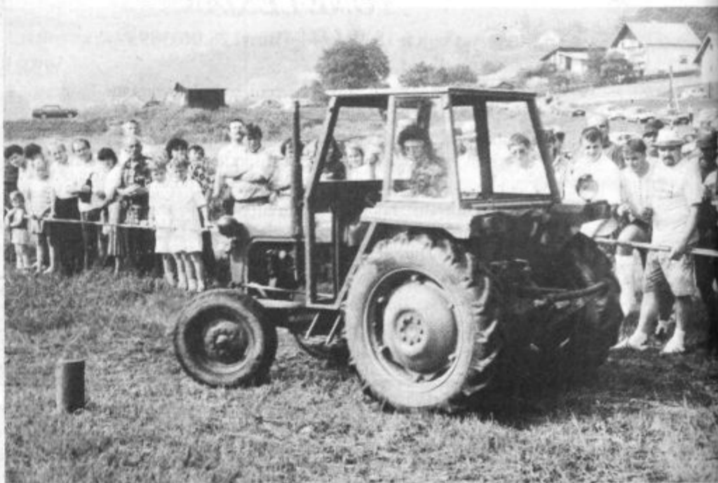
Spretnostna vožnja s traktorjem se je že prijela.