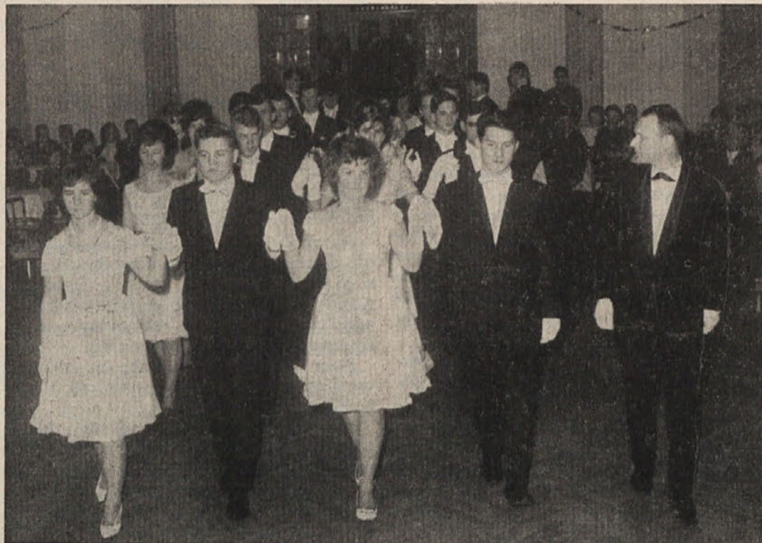
Slovesna otvoritvena poloneza na 2. Plesu slovenskih akademikov.

Pri vseh mizah so pričali veseli obrazi o dobrem razpoloženju, ki je zavladovalo za kratke ure v srcih obiskovalcev. Take dru-