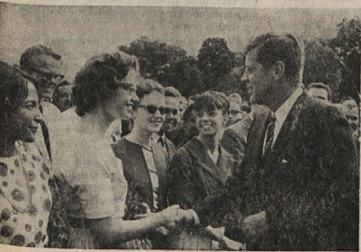
Ena izmed fotografij, ki kažejo, kako je sprejemal Kennedy deputacije mladih prostovoljcev pred Belo hišo.

Njuno začeto delo bo ostalo zapisano z zlatimi črkami v knjigi zgodovine. Edina pot, po kateri se lahko razvijajo odnošaji med obema blokoma, med raznimi verstvi, med narodi, med posamezniki, je ona, ki sta nam jo pokazala pokojnika. Njuno delo pa ne sme ostati nedokončano, treba ga je nadaljevati v korist celotnega človeštva.