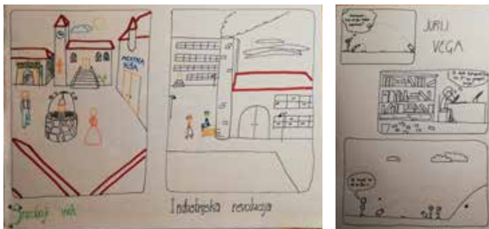
Gaja Vidic, Mesto pred 1. industrijsko revolucijo in po njej (3. e, 2018/2019).