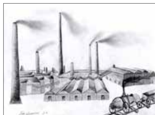
Eva Goropečnik, Prva industrijska revolucija (3. e, 2019/2020).