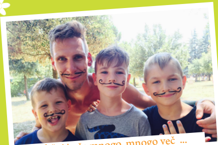
različni in še mnogo, mnogo več ...