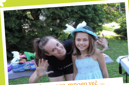
... in še mnogo, mnogo več ...