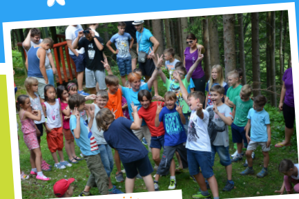
... ponosni in