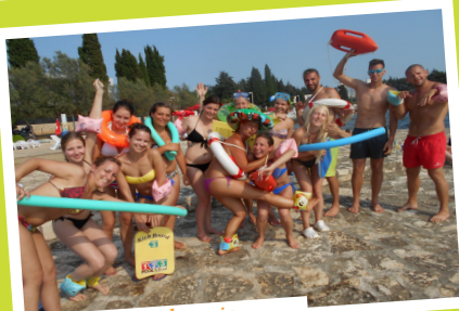
kopanje, plavanje ...