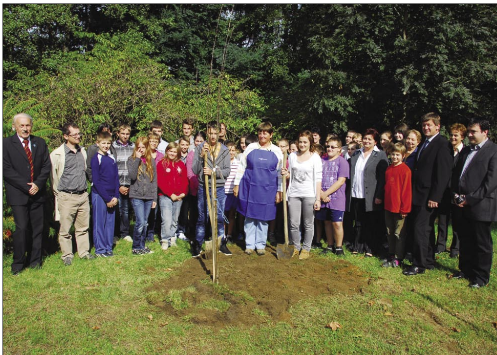
21. septembra 2012 je v okviru čezmejnega sodelovanja Slovenija-Madžarska obiskal našo šolo g. Franc Bogovič, minister za kmetijstvo in okolje R Slovenije. Učenci DOŠ Jožefa Košiča so skupaj z gospodom ministrom posadili jablano na šolskem dvorišču. Po obisku delegacije smo imeli delavnico z naslovom Jejmo in pijmo zdravo .