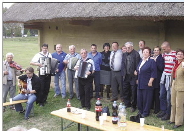
Gostje s Püconec s petimi goslari

uprav (slovenske, nemške, hrvaške in romske) v svojoj maternoj rejči na kratko po-