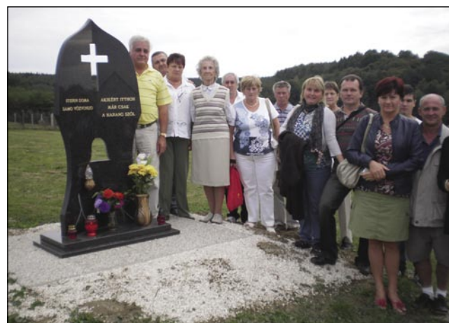
Domau med potjo smo bili v Slovenski vesi na grobišči, dej smo poglednili spomenik tistim, steri so z daumi odišli in jim doma samo zvonimo, gda merjejo

nas so imeli lejpi program. Po obedu se je začnila zabava, pogačavanje, saj se tū vsakšno leto srečamo stari znanci in tau komek čakamo. Dja sem se srečala s svojimi učenci, steri so že vsi gorizrasli, s starši, sausedi. Radi pa veseli smo