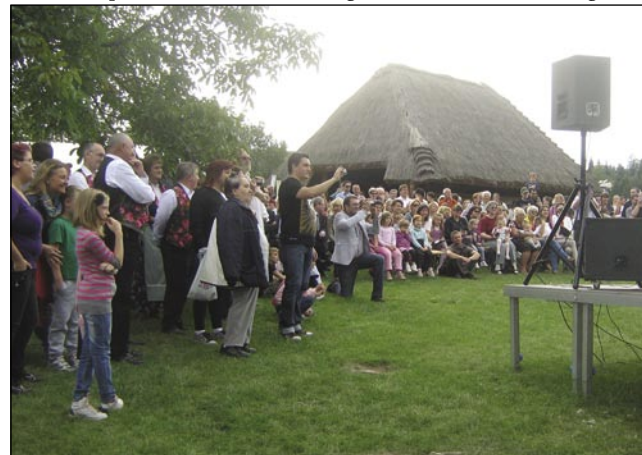
V Škanzeni se je zbralo sploj dosta lidi

Tau, ka majo slavski narodi dosta koražnosti pri spejvanji, nej trbej tomačiti. Tak je bilau na Narodnostnom dnevi tó. Pri enom rami je igrala pa spejvala vekša skupina Hrvatov, pri slovenskoj izi pa se je čüla ranč tak domanja muzika. Pri Slovencaj je bilau pet goslarov: tri fude, edna gitara