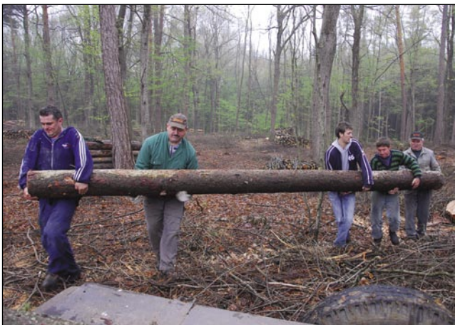
Boré smo podrli na vüzem

Andovčani že več lejt mamó tašó sodelovanje z njim. Gda so deske že cejlak vöposenile, te smo je najprvin oblili, ka je zavolé müdno delo bilau, sploy pa tak, ka vse tri strani je obliti trbelo. Dapa najvejšó delo je za nas itak podivanje bilau, zato ka sami smo delali. Najbola žmetno je začniti bilau, nej smo se mogli zgljijati, ka aj stenau mamó za mero ali folaš (hodnik), zato ka pri tašoj staroj kuči nika je nej gnako. Soba je dukša kak pet mejterov, vse deske smo samo na okna, pa