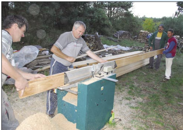
Deske smo sami zobli

v tisto smer leko nutra zdavali, kak so se dola dejvale. Leko povejm, ka smo se cejli den špilali s tejmí blajženimi deskami, bili so taši, šteri so brez obeda bili tam cejlak do večera.