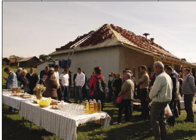
Pri kmečki sirane v Ratkovcih

20. septembra je potekala zaključna konferenca čezmejnegó projekta Krajina v harmoniji v konferenčni dvorani hotela Lipa v Monoštru. Projektni partnerji so predstavili končne rezultate projekta, katerega namen je ohranjanje biotske raznovrstnosti z uresničevanjem trajnostne rabe krajine na območjih Órség, Goričko in Mura Natura 2000. V okviru zaključne konference so udeleženci naslednji dan obiskali