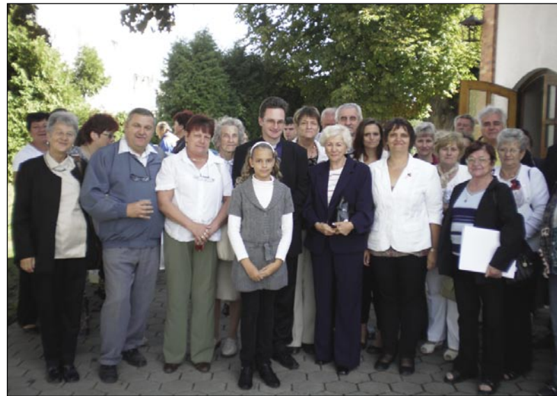
V Kuzmi pri cerkvi z domanjimi

V nedelo, 16. septembra, smo se napotili proti meji v Slovenijo. Bili smo na obiski pri KUD Rožika v Trdkovi pa Kuzmi. Kulturno društvo Rožika je pri našem društvu že petkrat bilao. Zdaj smo pa mi šli nazaj. Če smo že doma v Porabji v rojstni krajini, se vsigdar srečamo s kakšno domanjo skupino ali pa demo prek meje na Goričko v Slovenijo k našim prijatelom na obisk.