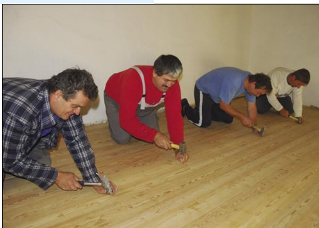
Po zabijanji, gda smo že skurok zgotauvili

Po vüzmi smo te petmejterske plotje (hlode) na žago pelali k Črnomi v Dolence, kak vsigdar, če kaj žagati trbej društvi. On je delo za nas, za šenki tisti leseni obcestni križ tö, šteroga smo dve leti nazaj blagoslovili. Tak ka mi,