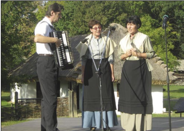
Püconski duet s Pištekom

ike z mali kamlov, lančece z džundža, bábe iz modrotiska (kékfestó) ali so delali z ilojcov, štero so okinčali na pri-