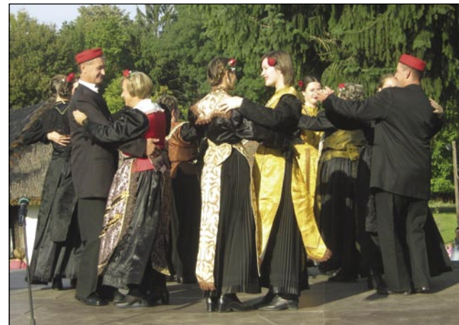
Skupina s Hrvaške je plesala dalmatinske tó

Po svetešnji gučaj so bili na redej programi, šteri so vnauge farbe meli. Na začetki smo leko ploskali mlajšam iz rovački pa nemški vrtcov, šteri so se lepau pripravili s plesom pa spejvanjom. Že med tem nastopom smo leko vidli vekšo skupino lidi v bejli, lepau okinčeni gvantaj. Tau je bila skupina KUD Strmec s Hrvaške, nej daleč od Za-