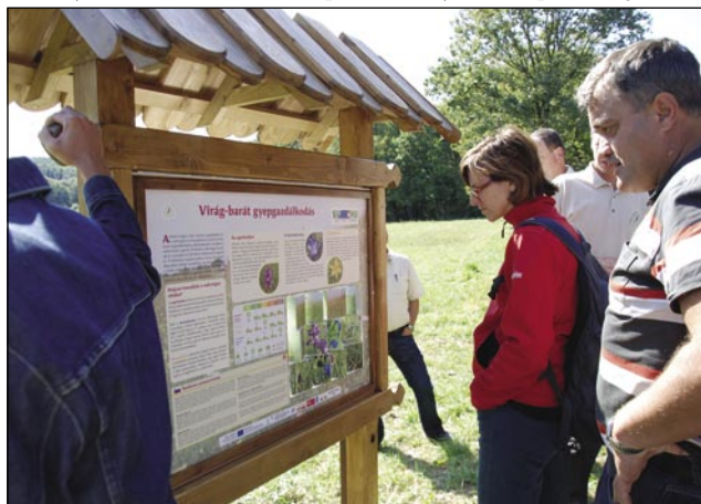
Informacijska tabla c Kercaszomorju

najpomembnejše lokacije v projektu. Zjutraj smo si ogledali dokumentarni film z naslovom Krajina v harmoniji v Óriszentpétru. Pot nas je nato peljala na Goričko, kjer smo v Ratkovcih obiskali prvo kmečko sirarno, Gorički raj, kjer izdelujejo mlečne izdelke iz kravjega, ovčjega in kozjega mleka, ki smo jih lahko tudi pokušali. Del opreme je sirarna pridobila iz omenjenega projekta. Druga postaja strokovne ekskurzije je bila v Mali Polani, kjer smo obiskali Zadrugo Pomelaj, ki se ukvarja z razvijanjem novih programov in produktov podeželja. Glavna dejavnost zadruga je pletenje izdelkov iz slame, koruznega ličja in rogoza, začeli pa so se ukvarjati tudi s peko tradicionalnih peciv. Na dvorišču obnovljene kmečke hiše so nas pričakali z ljudskimi pevci in godci ter