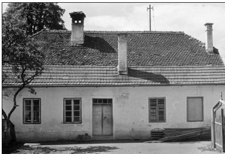
Poslopje šole Sv. Danijel, postavljeno leta 1863, na fotografiji pred letom 1984 (arhiv šole Šentanel).