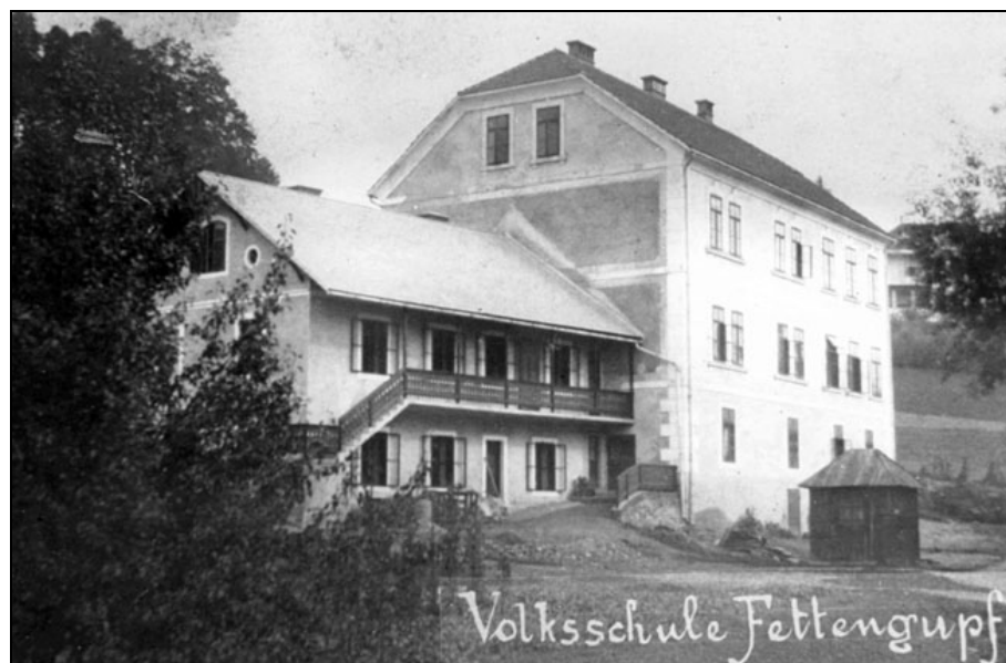
Poslopje šole Tolsti vrh, postavljeno pred letom 1906, na fotografiji do leta 1918.