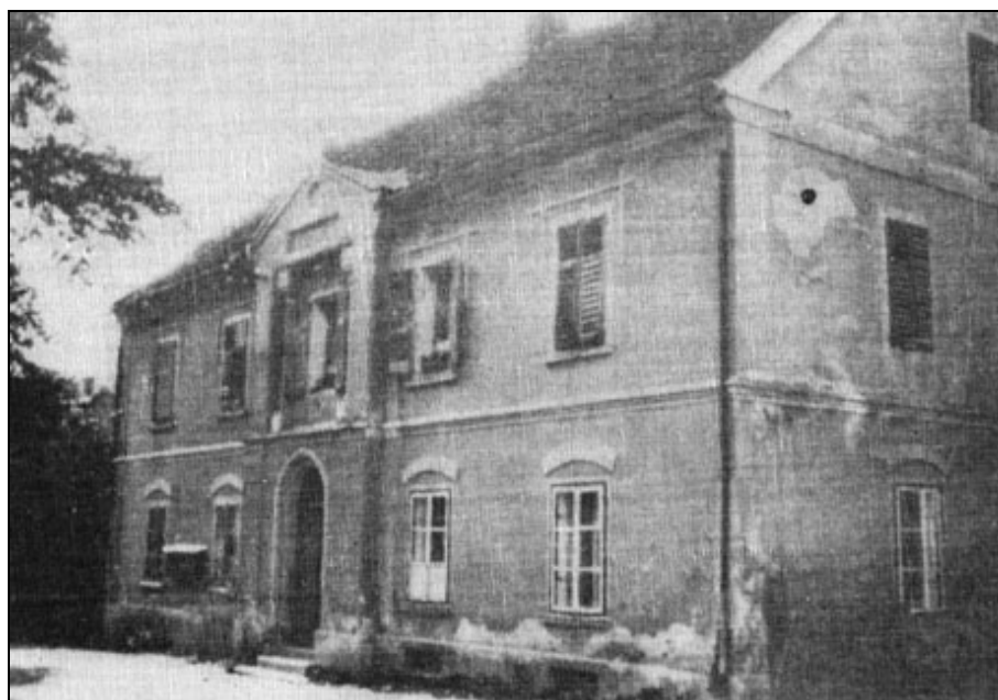
Šolsko poslopje v Farni vasi, postavljeno leta 1862, na fotografiji po letu 1918.