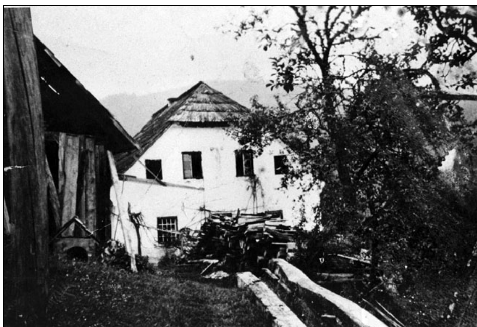
Poslopje šole Šelenberg, zgradba domačije izpred leta 1900, na fotografiji po letu 1950.

šolskega sveta so bili razočarani. Pri taki ureditvi je ostalo do leta 1937. Takrat so isti posestniki, ki so prej nasprotovali gradnji šole, le-to zahtevali. 220