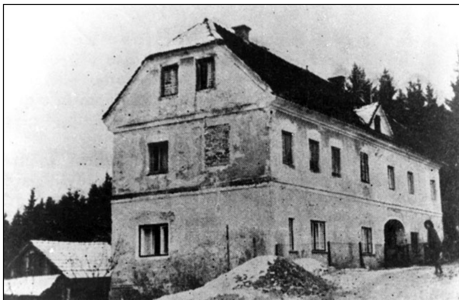
Šolsko poslopje na Lešah, postavljeno leta 1876, na fotografiji po letu 1918.

V šolskem letu 1889/1890 je bilo v prvem razredu 32 učencev in 26 učenk, v drugem pa 25 učencev in 20 učenk. Po propadu prevaljske železarne leta 1899 se je veliko družin izselilo in število učencev je začelo upadati. 188 Šolsko delo je v prvem razredu potekalo dvojezično. Začetnike so poučevali še v slovenskem jeziku. Ko pa so po nekaj mesecih obvladali slovensko abecedo, je popolnoma prevladala nemščina. Drugi razred je bil čisto