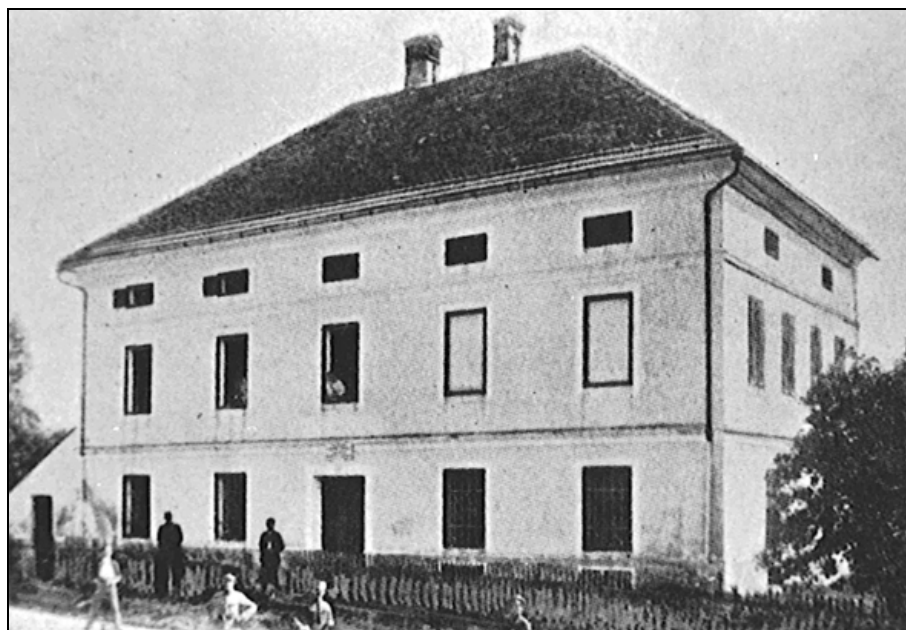
Šola Tunel, poslopje postavljeno okoli leta 1866, na fotografiji po letu 1918.