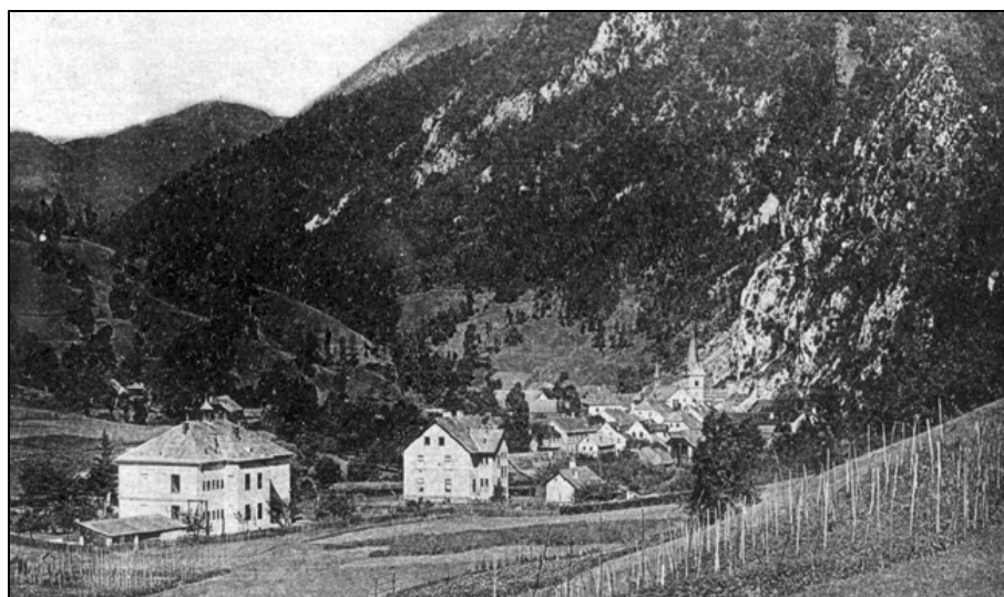
Šolsko poslopje v Črni, postavljeno leta 1908, na fotografiji pred letom 1927, desno bolnica.