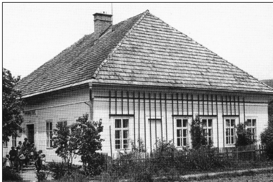
Šolsko poslopje šole v Kotljah, postavljeno leta 1907, na fotografiji po letu 1945.

Število učencev je od leta 1851, ko jih je bilo 34, vztrajno naraščalo. Leta 1881 jih je od 100 šolo-obveznih prihajalo k pouku 83, leta 1900 pa že 139, od tega 74 učencev in 65 učenk. Leta 1919 je šolo obiskovalo 111 učencev od 125 šoloobveznih. Šola je v letu 1900/1901 postala dvorazredna. Za drugi razred so v tistem času najeli prostore na domačiji Žerjav in uredili učne prostore. Šolski okoliš šole sta sestavljali naselji Kotlje in Podkraj. Od leta 1900, ko je šola postala dvorazredna, so začeli razmišljati o gradnji novega šolskega poslopja. Obstajali so še drugi načrti, predvsem ideja o preureditvi stare šole. Šolo za dvorazrednico so zgradili v dobrem letu in pol in jo 18. novembra 1907 izročili njenemu namenu. Šolo, nekoliko posodobljeno, uporabljajo še danes. Staro šolo so preuredili v učiteljska stanovanja. Površine ob novi šoli so namenili za obdelovanje, v najbolj sončen in miren kot pa so postavili uljnjak/čebelnjak. 226 Ob stari šoli so leta 1898 zgradili vodnjak, ki je bil zelo pomemben iz higienskih razlogov tako za šolo kot za celotne Kotlje. Učenci šole so bili zdravi, bila pa so obdobja, ko je za nalezljivimi boleznimi naenkrat zbolelo večje število otrok. Leta 1899 so razsajale črne koze, 1901 ošpice in leta 1906 ponovno ošpice ter dizenterija (griža). 227