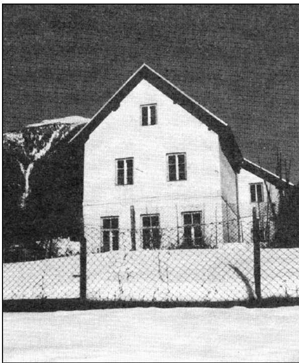
Šolsko poslopje v Podpeci, postavljeno leta 1904, na fotografiji leta 1956 (arhiv šole Podpeca, shranjeno v šoli Črna na Koroškem).

Takrat se je šola od kmeta Miheva preselila v novo šolsko poslopje v naselje Štoparjevo, ki ga je leta 1904 zgradila rudniška družba Bleiberger Union in ga kot svojo lastnino dala šoli v uporabo. 36 V tem obdobju je prišlo do sklenitve pogodbe med rudniško upravo, Občino Mežica in Deželnim šolskim svetom. Po njej je rudnik prepustil novo šolsko zgradbo šoli v brezplačno uporabo, pokrival stroške popravil na zgradbi in stroške za šolsko opravilo, učitelju nudil brezplačno stanovanje in kurjavo ter dajal 300 kron dodatka letno. Rudnik je preskrbel tudi kurjavo za šolo, ki mu jo je plačal Krajevni šolski odbor iz Črne po dnevni ceni. 37 Poleg nalog, ki jih je rudnik sprejel, se je tudi obvezal, da bo učence oskrboval s šolskimi potrebščinami, kot so učbeniki, zvezki in drugo. Katehetu in učiteljici, ki sta prihajala iz Črne, so plačevali za vsako pot po pet kron. 38 Šola sta od njenih začetkov vodila upravitelj šole iz Črne in Krajevni šolski svet Občine Črna. Občina Mežica, h kateri je šola spadala, je plačevala Krajevnemu šolskemu svetu v Črni ustrezen del davka za šolo v Podpeci in vabila svojega zastopnika na vsakokratno sejo Krajevnega sveta v Črni. Svet je šolo oskrboval z učili, plačeval je kurjavo in šolsko služkinjo. 39