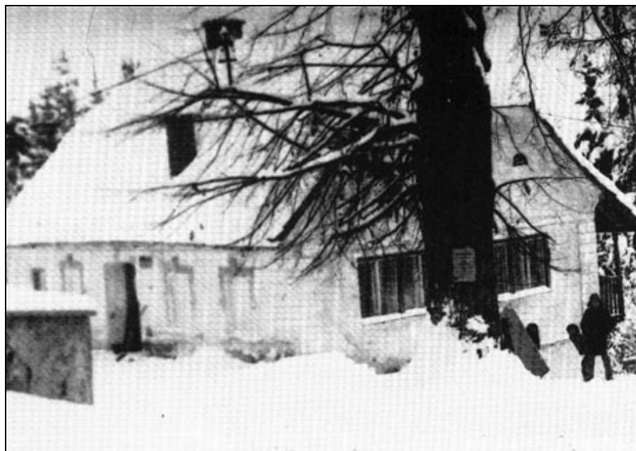
Poslopje šole Strojna, postavljeno pred letom 1907, na fotografiji leta 1947.