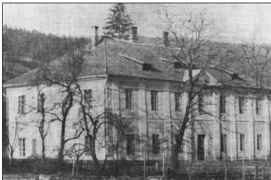
Šolsko poslopje na Prevaljah, postavljeno leta 1854, na fotografiji po letu 1918.

en učenec pa je bil evangeličanske veroizpovedi. 177 Za predpisana učila sta poskrbela Krajevni šolski svet in Odbor šolskega sklada. Odbor je poskrbel tudi za šolske potreščine otrokom članov šolskega sklada. Revne otroke sta oskrbovala Krajevni šolski svet in Cesarsko-kraljeva založba šolskih knjig z Dunaja, ki je šolarjem podarila okoli 60 knjig letno. Šola si je z leti ustvarila knjižnico za učence in odrasle. V njej je bilo 332 knjig: v učiteljski 88, v kmetijski 44 in v ljudski 38. Pomembne izkušnje so učenci pridobivali s praktičnim delom na šolskih zemljiščih pri obeh prevaljskih šolah. Urili so se v sadjarskih veščinah in v čebelarstvu. Učenke so se ukvarjale s pridobivanjem zelenjave in cvetja. Ob koncu šolskega leta 1890 so učenci šole sodelovali s svojimi izdelki na razstavi z učenci drugih šol. 178 V obdobju po letu 1890 je šola postala šestrazredna. Število učencev je naraščalo. 179 Ko je leta 1899 dokončno propadla prevaljska železarna, ki je bila ena od glavnih mecenov šole in njene nemške usmerjenosti, so se tudi v šoli začeli hudi pretresi. Zaradi množičnega izseljevanja (v obdobju od 1890 do 1900 se je izselilo 907 Nemcev in 43 Slovencev; glej opombo 168) se je začelo zmanjševati število učencev, usihala je denarna in materialna pomoč šoli, kar je vplivalo na redno in stranske dejavnosti šole. Težave so se nadaljevale vse do konca Avstro-Ogrske 1918. 180