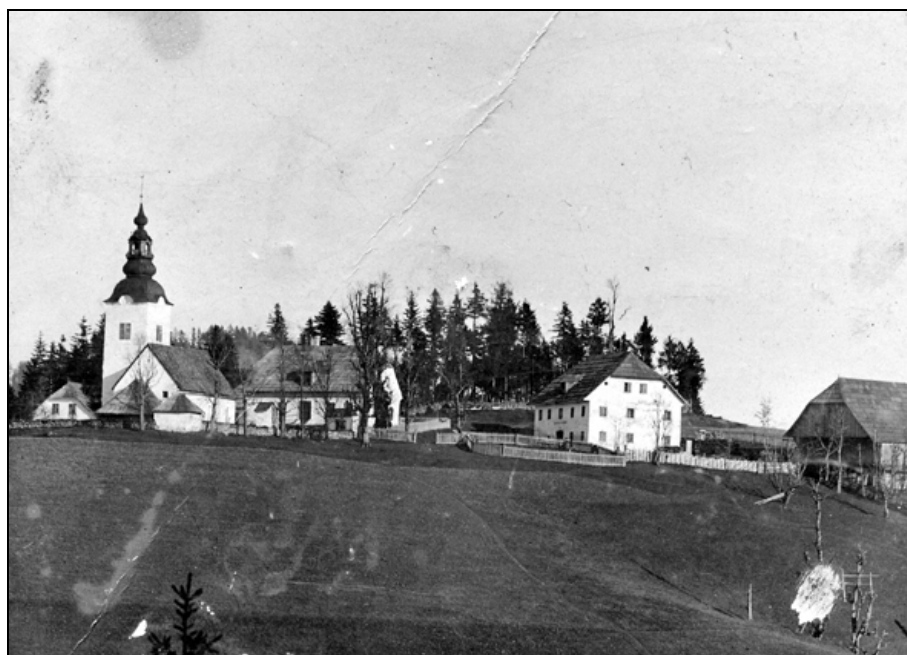
Domačija Mežnar v Zgornjem Javorju, šola je bila v drugi zgradbi z desne, na fotografiji pred letom 1910 (hišni arhiv domačije Lipold v Koprivni 13,).