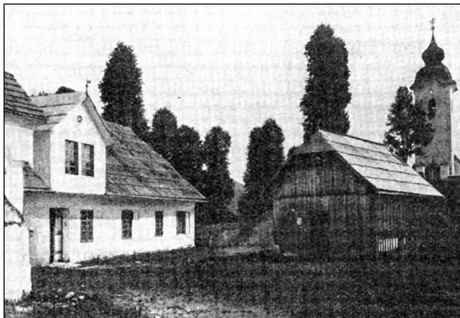
Šola v Koprivni, v poslopju župnišča v Koprivni, na fotografiji leta 1913.

Kapla, s sedežem v Beljaku 60 . Na cerkvenem področju je bila (do nastanka samostojne župnije leta 1792 61 pri cerkvi sv. Jakoba Starejšega) podružnica črnjanske fare. V 19. stoletju in do leta 1918 je spadala pod šolsko upraviteljstvo v Črni in pod Krajevni šolski svet v Železni Kapli. 62