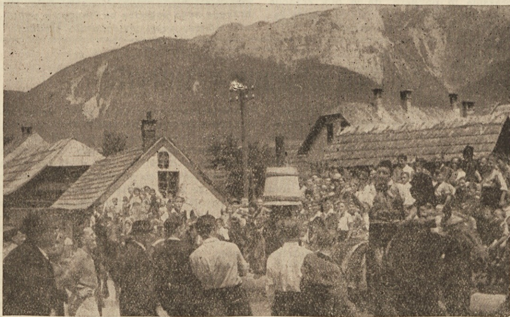
Slovenski običaj na Koroškem — „štehanje“

Upamo tudi, da se bo našel kdo, ki bo to „nepisano“ zgodovino našega naroda prenesel na papir in nam pokazal kaj pomenijo in s čim so v zvezi navade, ki jih še od časa do časa zasledimo med našimi ljudmi.