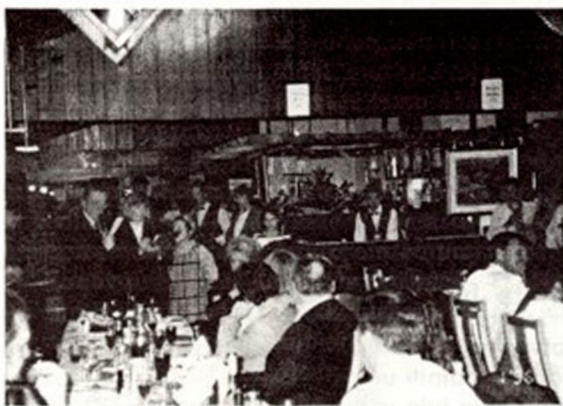
Prvega plesa se je udeležilo okoli sto gostov.