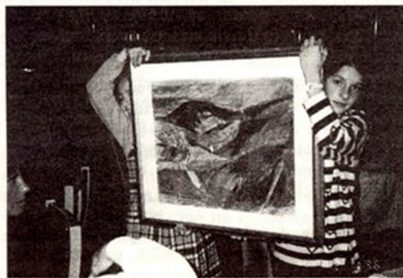
Pri licitaciji slik so pomagali tudi najmlajši člani Civilnega gibanja