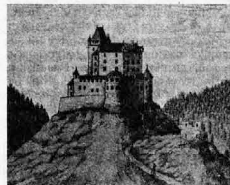
Žovnek v 17. stoletju

Grof Friderik Celjski se je pozneje podal v pridobivanje posestev. Nakupil je hiše na Dunaju, posestva v Vipavi, na Korškem, Dolenjskem itd. Posojal je denar celo Habsburžanom. Po vsem tem daleč naokrog ni bilo grofa, ki se v bogastvu in moči mogel meriti z njim. Zato mu je cesar