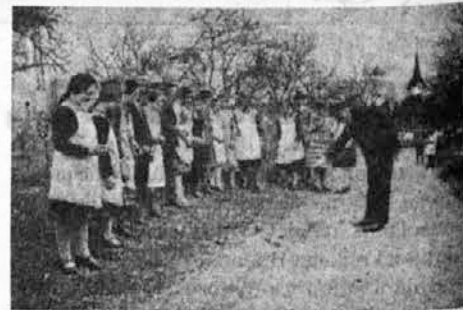
Trkljanje s pirhi

Na Slovenskem se pobarvana oz. polikana velikonočna jajca imenujejo tudi pisanice (Bela krajina) ali pisanke in se uvrščajo med najlepše okrašene primerke v Evropi. Za velikonočna jajca iz Bele krajine in Prekmurja so tradicionalno značilni geometrični in stilizirani liki, medtem ko na primorskih in gorenjskih pirhih prevladuje naturalistična ornamentika, ki posnema na-