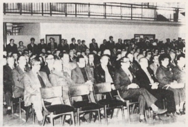
V ospredju so dobitniki priznanj in nagrad Louisa Adamiča, Jurčičevi nagrajenci ter del najuglednejših gostov slavnostne seje