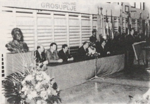
Delovno predsedstvo slavnostne seje

V počastitev praznika občine Grosuplje je bila slavnostna seja skupščine občine in DPO občine Grosuplje v prostorih novozgrajene telovadnice v Višnji gori, o čemer smo že obširneje poročali v oktoberski številki "Naše skupnosti". Teleobjektiv pa je med drugim zabeležil: