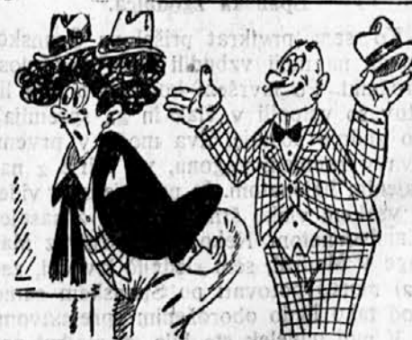
»Zal nimamo klobuka vaše številke, toda ali ne bi vzeli dva?«

čisto in zračno, s hrano ali brez, išče tovarniška uradnica. Naslov v upravi lista. 2044