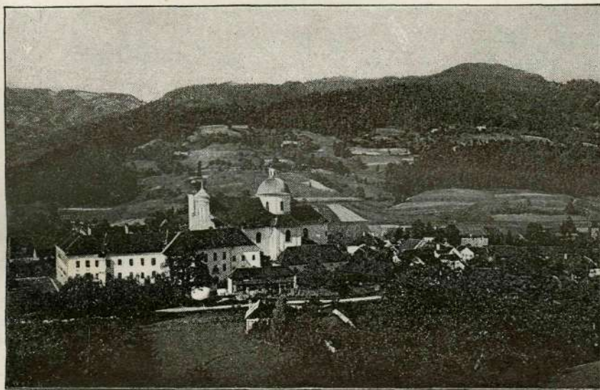
Cerkev in grajščina v Gornjemgradu.

Opati benediktinskega samostana v Gornjemgradu so bili: Berthold (1145—?), Engelbrecht (1173—1175), Curtirannus (1209—1228), Albert (1228—1240), Henrik I. (1241—1246), Henrik II. (1247—1268), Janez I. (1268—1286),