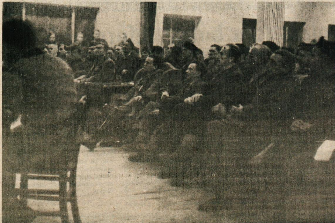
Delegati II. zasedanja AVNOJ-a na prizorišču zgodovinskega zasedanja v Jajcu.