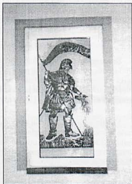
Gasilski zavetnik sv. Florjan

Če samo omenimo Prekopo, moramo na prvo mesto postaviti Prostovoljno gasilsko društvo, ki mu po dejavnosti ni para daleč naokoli. Deluje od leta 1922 in po