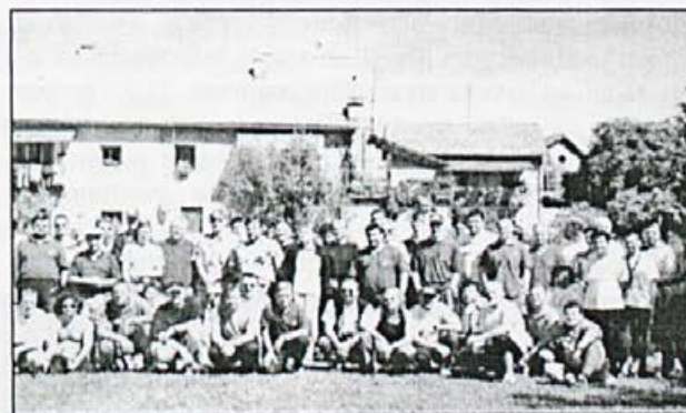
Krajanji in potapljači na obali Krke, pred začetkom akcije