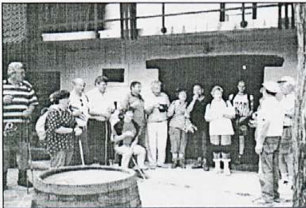
Postanek pohodnikov v vinski kleti našega župana v Blatniku, kjer so se dodobra podprli z domačimi dobrotami