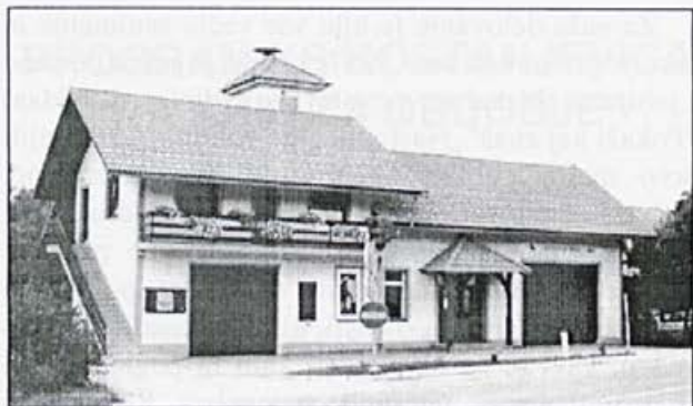
Gasilski dom je v ponos krajanom Prekope