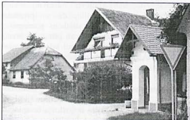
Vaški motiv iz Prekope

lahko računamo v primeru nesreče ali potrebe po dobri gasilski veselici.