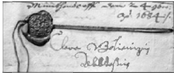
Dokument s pečatom rodbinskega grba opatinje Klare Golijanič iz leta 1684 (ARS).