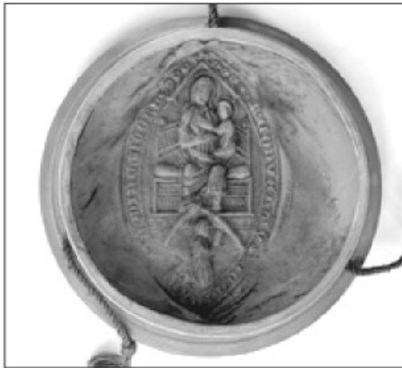
Prvi od dveh visečih pečatov mekinjskega samostana iz leta 1680; upodobljena je Marija z Detetom, ki sedi na prestolu (ARS).