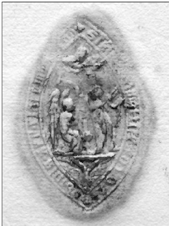
"Papirnat" vtisnjen pečat mekinjskega samostana iz leta 1685 (NSAL).

Kot vtisnjen na papir, pa se obravnavani odtis pečatnika pojavlja na dokumentih iz druge polovice 17. stoletja: prva dva sta iz let 1667 in 1668, 12 naslednja dva iz let 1684 13 in 1685, 14 zadnji doslej znani pa je iz leta 1689. 15 Pri vseh gre za konventne pečate. Ob tem je treba omeniti, da so te pečate pečatili s tehniko, ki se je razvila, ko so za zapisovanje listin začeli uporabljati papir: pečat so namreč vtisnili v papir, ki je prekril