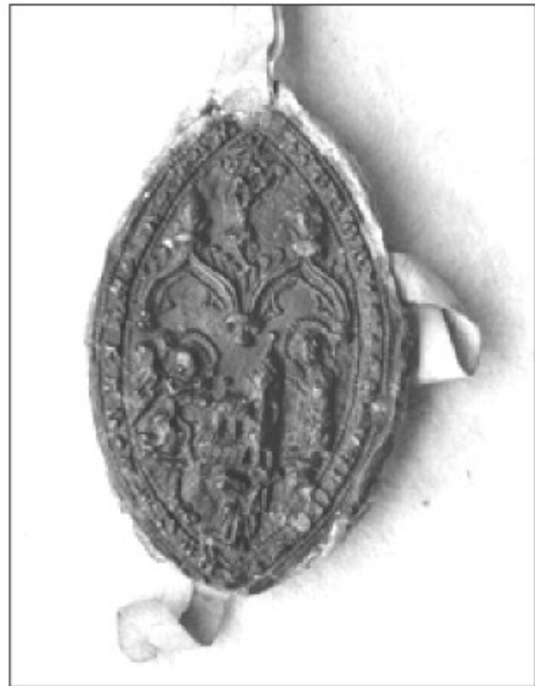
Pečat (konventni) škofjeloškega samostana iz leta 1358 (ARS).

V novem veku, zlasti v 18. stoletju najdemo v dokumentih nov tip samostanskega pečata. Bil je manjši (premer 15–20 mm) in okrogle oblike ter vtisnjen v rdeč vosek. 32 Uporabljali so vtisnjen pečat. Na njem je upodobljena Marija, ki ima roke sklenjene v molitvi. Okrog njene podobe je pokončen ovalen krog, iz katerega izhajajo žarki. Okoli svetniškega sija na glavi vidimo v polkrogu nanizanih 8 (od skupaj 12) zvezd. Ob robu pečata je latinski napis: + MON.+ S.+CLARAE +LOCOPOLI+.