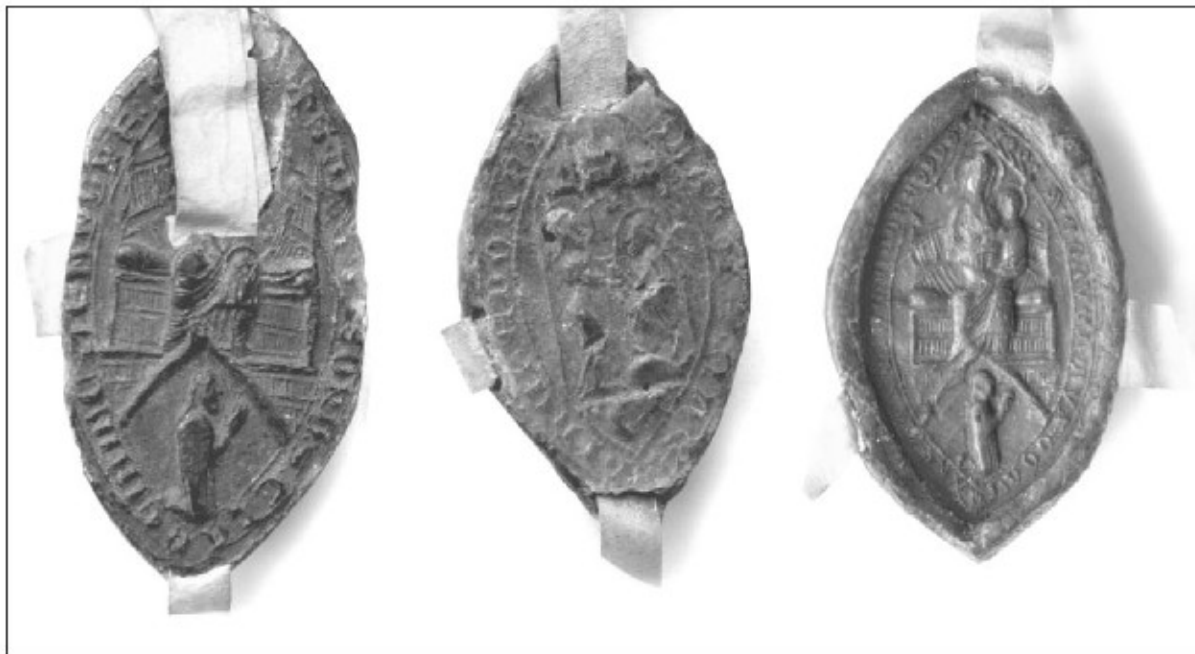
Trije pečati mekinjskega samostana iz obdobja srednjega veka: prvi (z leve) je iz leta 1339, drugi iz 1381, tretji pa iz leta 1391 (ARS).

V 15. stoletju pa je samostan začel uporabljati tip pečata, ki se v svoji upodobitvi navezuje na pečat iz leta 1381. Njegov medeninasti pečatnik se je – kot edini od vseh naših samostanskih pečatnikov – ohranil do danes v zbirki pečatnikov Narodnega muzeja v Ljubljani. Tudi ta je koničasto-ovalne oblike, velik 30 x 50 mm, napis na zunanjem robu pečata pa se v gotskih minus-