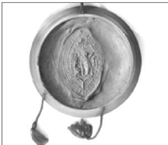
Drugi od dveh visečih pečatov mekinjskega samostana iz leta 1680; na njem je upodobljeno oznanjenje Mariji.