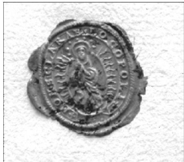
Vtisnjeni pečat škofjeloškega samostana iz 18. stoletja.