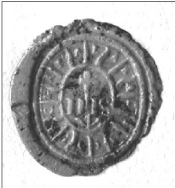
Vtisnjeni pečat ljubljanskega samostana iz 17. in 18. stoletja (ZAL).

Na njem je zapisan Kristusov monogram IHS, ki ima na sredini manjši križec. Napis oz. monogram obkroža krog, iz katerega izhajajo črte oz. žarki. Med črtami, ki ustvarjajo nekakšna polja, je moč razbrati latinski napis: + MON. CLARA. LABACI . 33