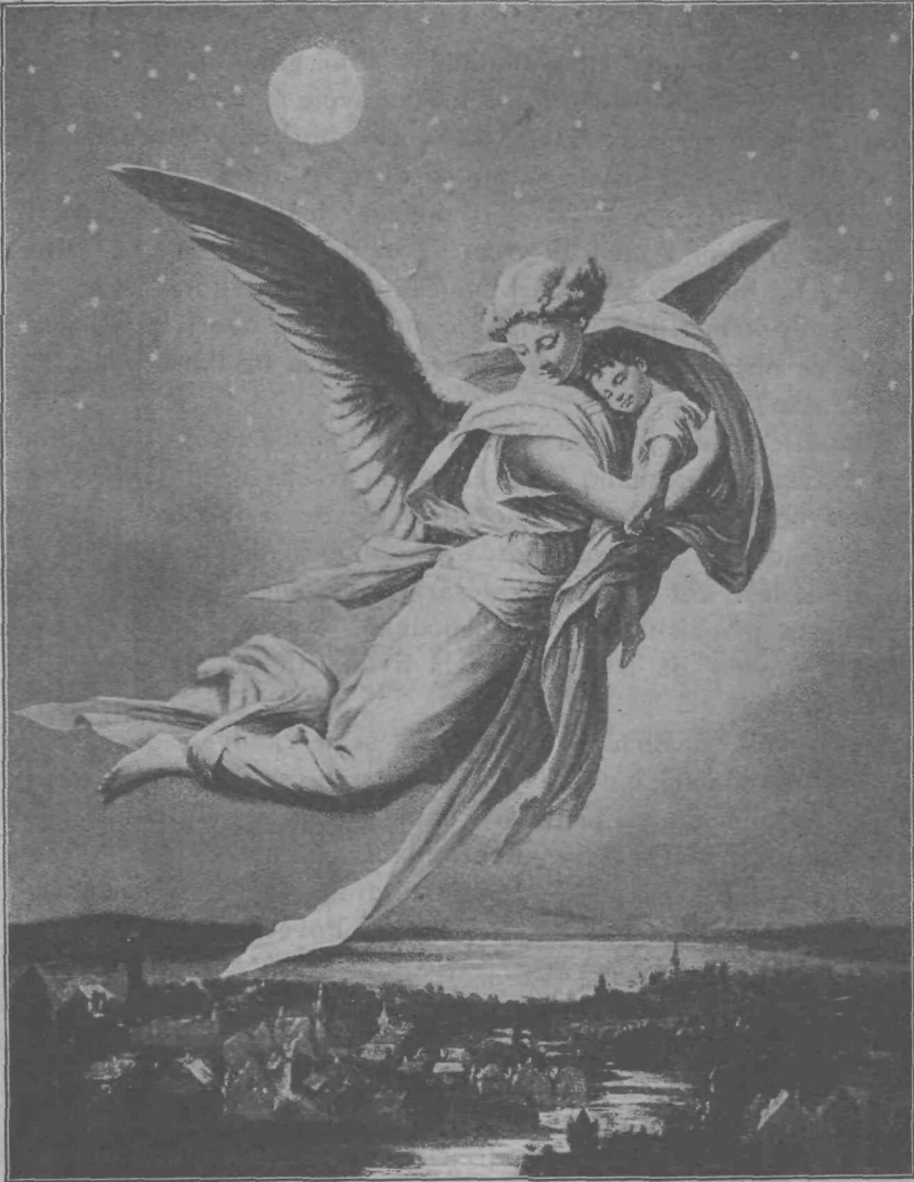
»Meni je tako lepo!«