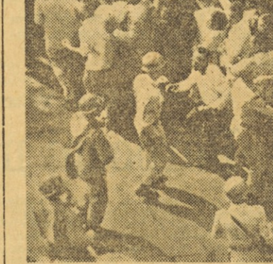
Na nedavnih volitvah v Braziliji so dobili pristaši bivšega predsednika republike Vargasa več glasov kot doslej.

Torej se je tudi pri naših vzhodnih sosedih že obrnilo na bolje.