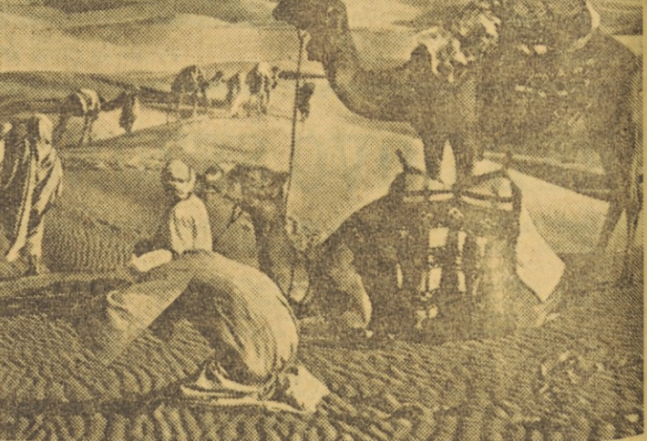
Idila v puščavi. Toda to ni več kristal, samo gmota kamenja je še, ki se je pogreznilo vase.

se, da bi nas prezrl. Treba nas je videti, kakor je morebiti treba videti piramide, te vsestransko ne-praktične klade v tisoletjih nakopičene človeške neumnosti.