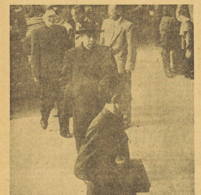
V Zenevi se je pravzaprav začelo. Takrat se je Mao Ce Tungova Kitajska prvič vidno uveljavila v mednarodni politiki.

Ob podpisu sporazuma o Trstu so prav ti zagrnali velik krik in vik (skupno z neofašisti sovoda): »To je izdaja domovine!«.