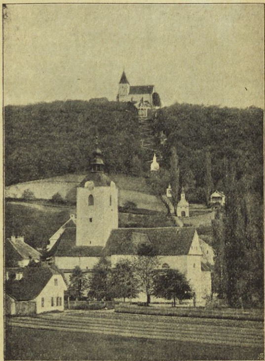
Šmarje pri Jelšah