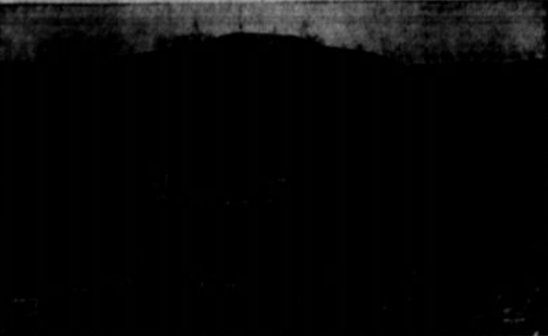
Sv. Gabrijel (646 m.) v opredelju samostan Kostanjevica tik nad Gorico. (Ves ta predel pripada Jugoslaviji.)

te velikega prepada, ki je nastal med Vzhodom in Zahodom, predvsem med komunistično Rusijo in wallstreetsko Ameriko.