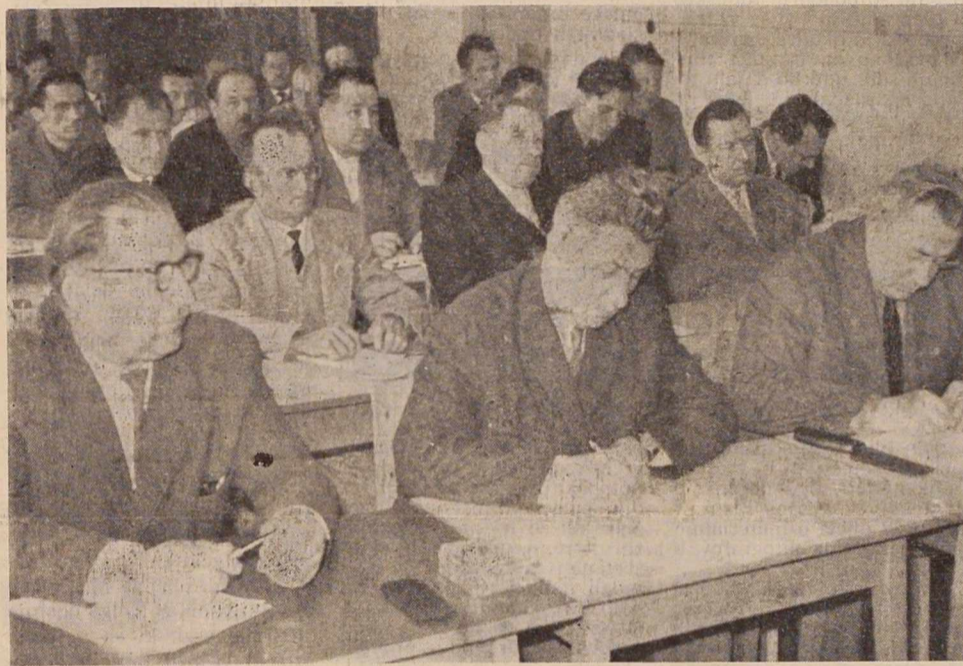
M. Sobota, v ponedeljek 20. aprila — posvetovanje o kmetijstvu: jasnejše začrtati poti razvoju kmetijstva

Če smo objektivno kritični, moramo radi ali neradi zastavljati vprašanje tudi tako. Dajmo včasih malo na rešete našo družbeno odgovornost, ki jo zelo radi poudarjamo. Potem šele kritizirajmo.