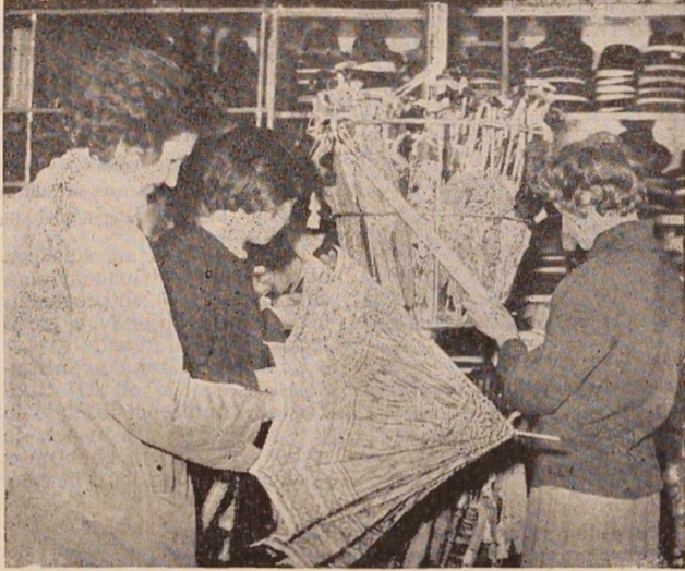
Tudi pri stolu v poslovalnici »Galanterija« Trgovskega podjetja »Merkur« je vsak dan živo. Saj ni čudno: tudi tukaj so cenjenim potrošnikom vedno na voljo kvalitetni dežniki z oznako: Tovarna dežnikov in pletenin Lendava