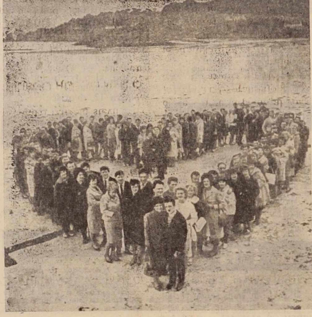
NOVOPEČENI ZAKONCI — na britanskem otoku Jersey seveda so deložni olajšav pri plačevanju davka. Rezultat: v minulem mesecu 70.000 porok! Na sliki: srečni novoporočenci. (po Ilustrirani politiki)

nemški ujetniki pisali takratnemu notranjemu ministru Aleksandru Rankoviću. Toda kako so ravnali z ujetniki pa tudi popolnoma nedolžnimi ljudmi, ženami in otroci v Nemčiji? Vsi ti »zgodovinarji« so zelo sumljivo barve, toda na srečo tudi slabo zakamufirani.