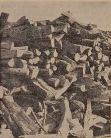
Drva, kurjava — skrb mnogih sedaj pred zimo

Tu in tam so se oglasili posebneži: »Anketa je anonimna. Zakaj? Saj smo vendar svobodni ljudje in lahko povemo vse, kar mislimo.»