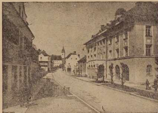
Gor. Radgona — občinsko poslopje z glavno ulico, ki povezuje mesto v gospodarsko središče

Po dosedanjih analizah so občinski odborniki lahko ocenili, ka-