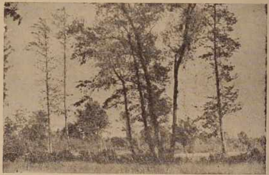
Kmalu bodo tudi drevesa izgubila svoje mikavno oblačilo. Listje rumeni in odpada