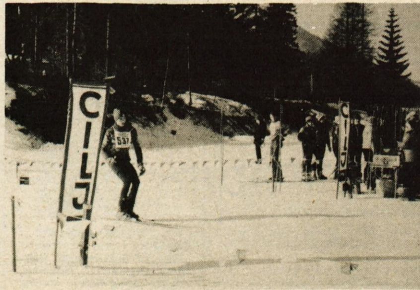
1020 članov sindikata iz kranjske občine je sodelovalo na igrah v Gozd Martuljku. Nastopajoči so pokazali veliko mero borbenosti in smučarskega znanja.