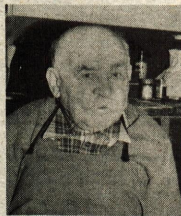
Rojen med dobrimi ljudmi, trboveljskimi ni maral po stopinjah očetov. Čevlje je hotel narediti jih je sto, Kdo bi vedel? Po prvi vojni ga je za Tržič. Krepkega, postavljenega v najboljših letih. Košati avstroogrski spominjajo na mladost osiveli so. Zrasel se je z ljudmi in njihovimi nameni. Vzljubil jih je vse skupaj. V devetosemdesetih letih gre.

Bil je pomočnik pri dveh tržičkih mojstrih, preden se je osvojil. Pred drugo vojno. Delavnica zdaj sameva. Že deseto leto. Ure, dneve, mesece je prežedel na svojem stolčku, urezoval, usnje, vlekel dreto in zabijal lesene žebelje. Njegovi prsti so otrpli od dela. Zaslužek ni bil bog ve kaj. Toliko, da je preživel družino. Zdal mu ni treba več. Pokojnino ima. Njegovi čevlji so trajali. Ljudje so jih radi kupovali. Celotno lano, Zagreb in druga velika mesta jih je pošiljal. Danes so čevlji dobri samo za oko. Rad je delal. Nikoli mu ni bilo pretežko. Izbral je prave ljudi. Tudi sin je čevljar. Veliko je hodil. Dve, tri, pet ur. Pri hoji se je razgibal. Še vedno hodi. Vsako popoldne. Do Pristave ali Križev in nazaj. Da bi še dolgo!