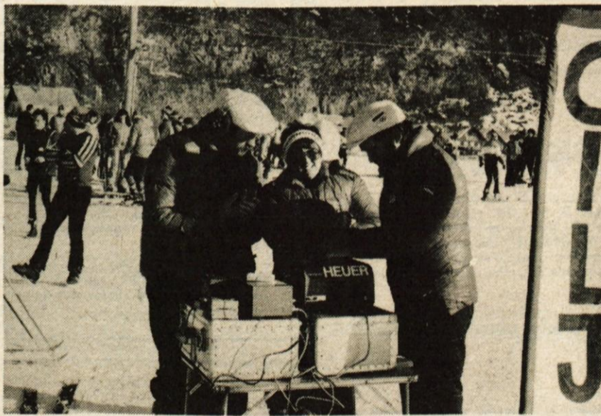
Smučarski delavci iz Mojstrane so poskrbeli za tehnično plat tekmovanj v veleslalomu. Na sliki del njihove ekipe časomerilcev.