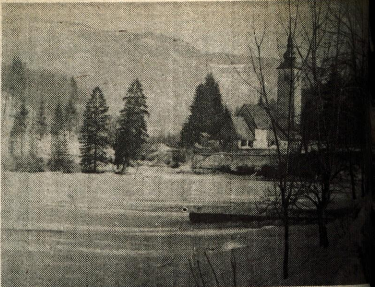
Bohinj – Gostje, ki se v teh zimskih dneh mudijo v Bohinju, dovolj možnosti za rekreacijo. Bohinjsko jezero je že nekaj zamrznjeno in tako izredno privlačno za mlade in starejše valce. Turistično društvo Bohinj-jezero pa je minulo nedeljo postalo tudi za živahno tekmovalno rekreacijo, saj je organiziralo tekmo v sankanju ter drsanju na jezeru. Če so gostje prikrajšani za dostop do Vogel z žičnico, imajo obilo možnosti, da se zabavajo na debeli skorji bohinjskega jezera.