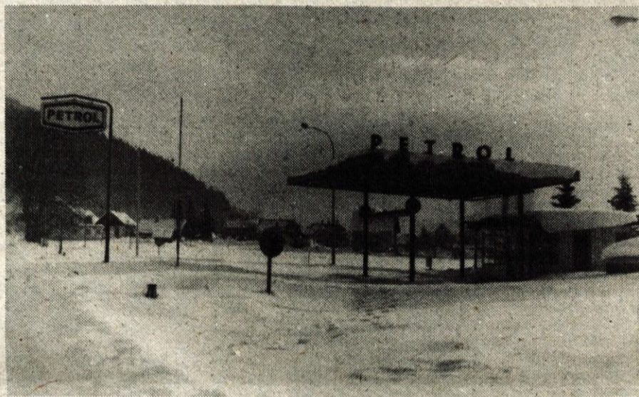
Opuščena rateška črpalka – Lansko jesen so prenehali prodajati naftne derivate na bencinskem servisu Petrola v Ratečah. Na črpalko, ki uso zimo sameva prekrita s snegom, se zateka le divjačina ob slabem vremenu. Domačini se upravičeno sprašujejo, zakaj je tako! Odgovornim predlagajo, naj bi tod vendarle prodajali bencin in tudi nafto, saj je v vasi razen avtomobilov veliko traktorjev in drugih kmetijskih strojev, na končni avtobusni postaji pa se prav tako vsak dan ustavi precej avtobusov. (A. K.)