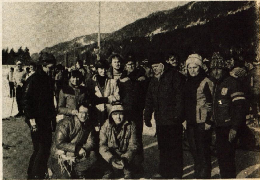
Del članov organizacijskega odbora 14. zimskošportnih sindikalnih iger kranjske občine

Nad 1000 članov osnovnih organizacij sindikata iz kranjske občine se je udeležilo letošnjih zimskošportnih sindikalnih iger kranjske občine v Gozd Martuljku — Nekateri so se le prijavili, na start pa jih ni bilo!