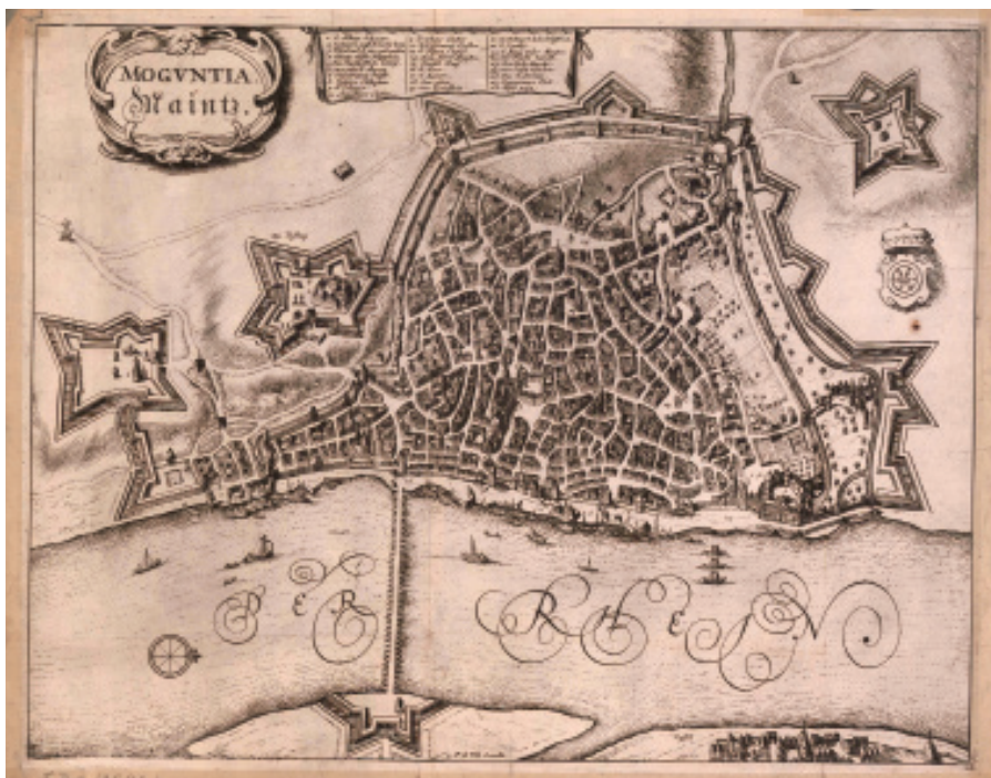
Mainz, načrt mesta, 1600–1650.