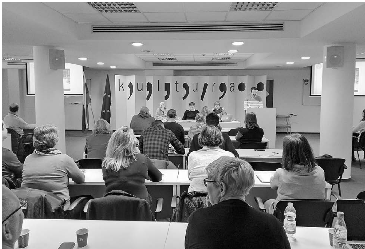
Kolokvij Arhivskega društva Slovenije februarja 2020