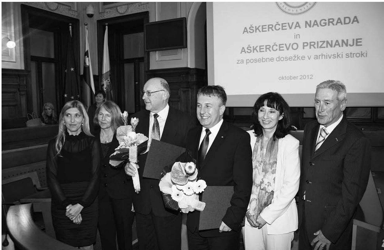
Podelitev Aškerčevih nagrad in priznanj leta 2012

na področju varovanja arhivske dediščine, strokovnega izobraževanja, izdelave pomagala za uporabo arhivskega gradiva, pripravo arhivskih priročnikov ter arhivske zakonodaje, za prispevek k popularizaciji arhivov in arhivske dejavnosti ter za objave arhivskega gradiva, 90 so zagotovo pripomogle k prepoznavnosti in uveljavitvi nagrade in priznanj. V dvajsetih letih se že lepo število prejemnikov lahko ponosno pohvali, da je bilo njihovo delo prepoznano. Na tem mestu naj mi bo dovoljeno prepoznati delo Arhivskega društva Slovenije in omeniti nagrado, namenjeno društvu. Namreč, leta 1995 je ob 40-letnici delovanja društvo iz rok takratnega predsednika Republike Slovenije prejelo častni znak svobode Republike Slovenije za dolgoletno delo, 91 pomembno za arhivsko dejavnost in za zasluge pri ohranjanju slovenske kulturne pisne dediščine. Morda je zdaj priložnost, da država znova prepozna vlogo društva in prihodnjemu 70-letniku za rojstni dan podeli še kakšno priznanje.