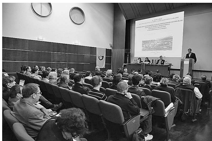
24. zborovanje Arhivskega društva Slovenije v Dolenjskih Toplicah leta 2009