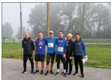
Najhitrejši v moški konkurenci

Letos so prvič tekli tudi otroci do 15. leta starosti.