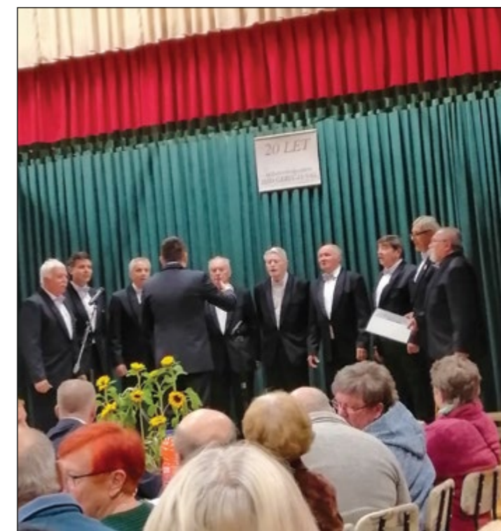
Člani MoPZ DPD Svoboda Majšperk so stalnica glasbenih večerov v Gerečji vasi, tudi ob 20. jubileju.