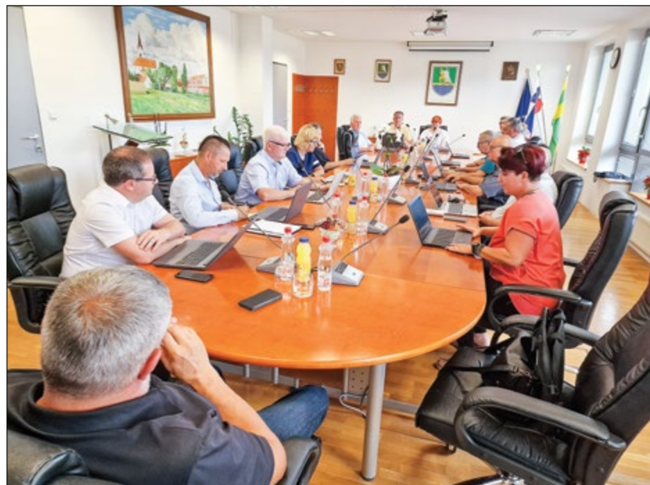
V oktobru je hajdinski občinski svet še zadnjič zasedal v tem mandatu.

Zaradi oddajanja občinskih nepremičnin v najem, ki izkustveno ne presega 10.000,00 EUR, je gospodarno sprejeti cenik najemnin za nekmetijsko rabo. V primeru, da občina ne sprejme cenika zakupnin za nekmetijsko rabo,