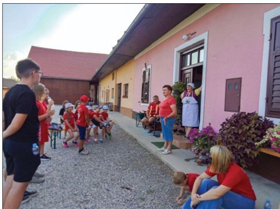
Letošnji taborniški utrinki iz PGD Hajdina