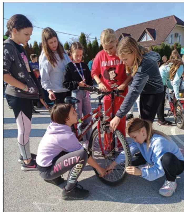
Priprave na kolesarski izpit.