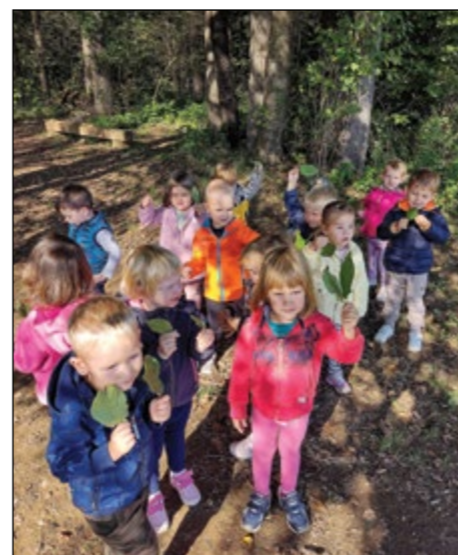
Otroci modre igralnice raziskujejo gozdna tla.