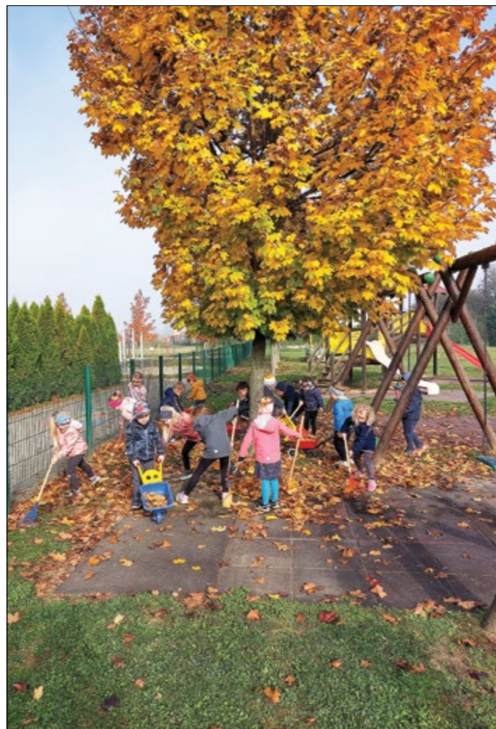
Otroci rumene igralnice ob grabljanju jesenskih listkov, da bo naša okolica vrtca lepa.