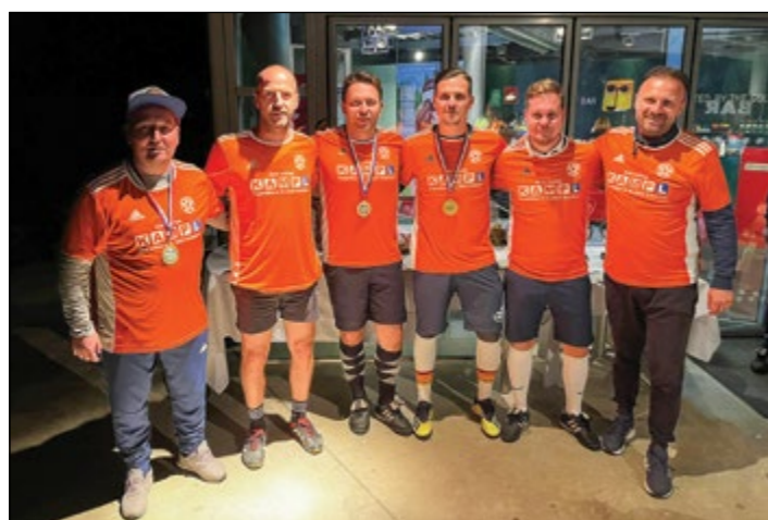
Prvo mesto ekipno – Gerečja vas