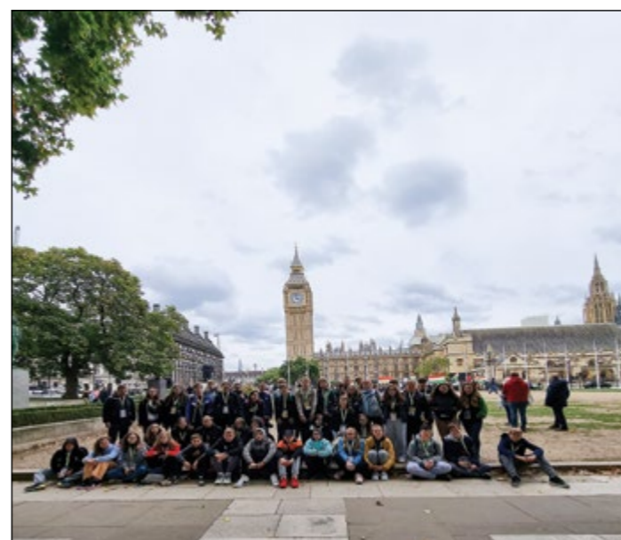
Udeleženci ekskurzije v London