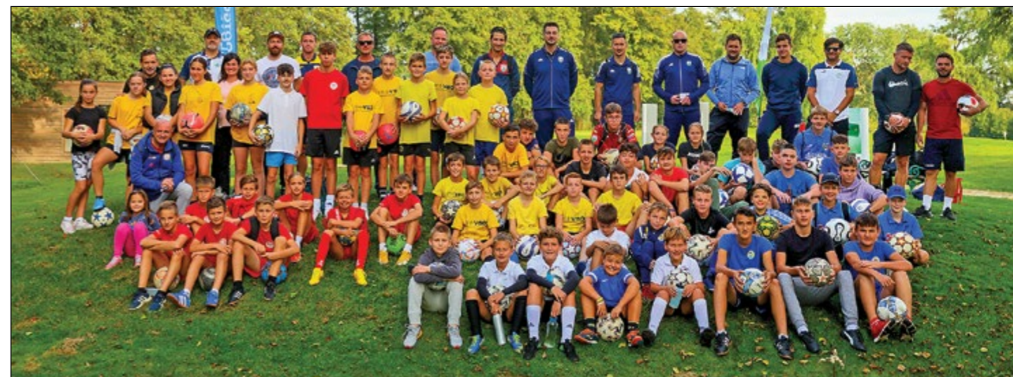
Med udeleženci državnega mladinskega prvenstva v footgolflu.

Nova generacija učencev, naši prvošolci a- in b-oddelka, se je skupaj z učitelji odločila, da bodo svoji drevesi posadili na igrišču z igrali, saj potrebujejo senco v sočnih dneh. Tako so si izbrali najhitreje rastoče drevo na svetu, pavlovnijo. Za pomoč pri nabavi dreves smo naprosili podjetje Ekotal – čiščenje, urejanje okolja iz Kidričevega, ki nam je z veseljem priskočilo na pomoč. Poleg pavlovnij so nam podarili še šest lepih sadik lipe, s katerimi smo zamenjali nekaj slabše rastočih dreves iz omenjenega drevoreda me-