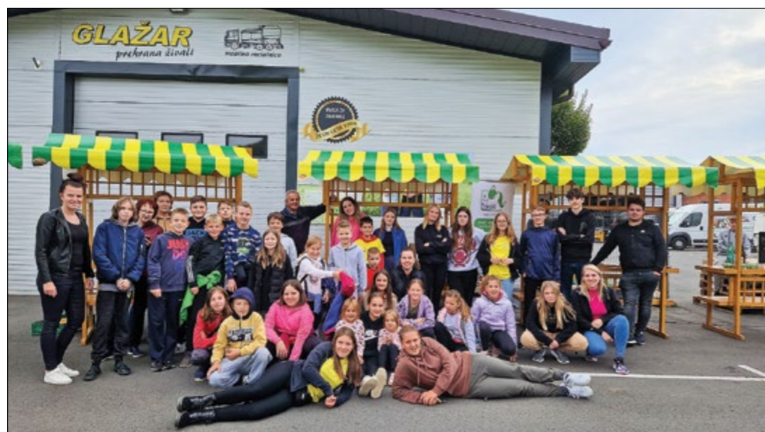
Ponudniki in obiskovalci lokalne tržnice pri Hajdoški korpi pri Glažarjevih v Hajdošah