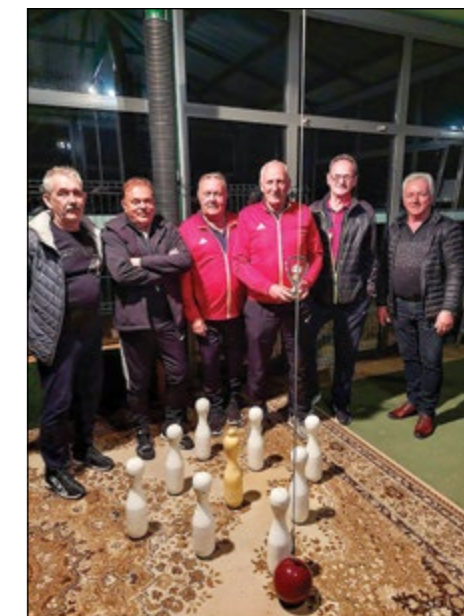
Drugo mesto ekipno – ŠD Hajdoše