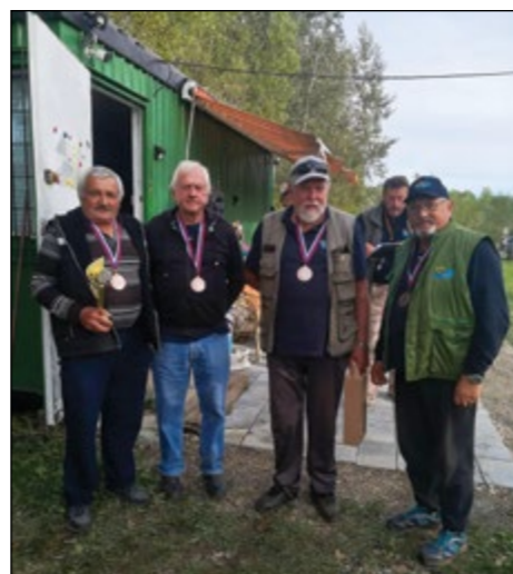
Tretje mesto je osvojila ekipa Skorbe.