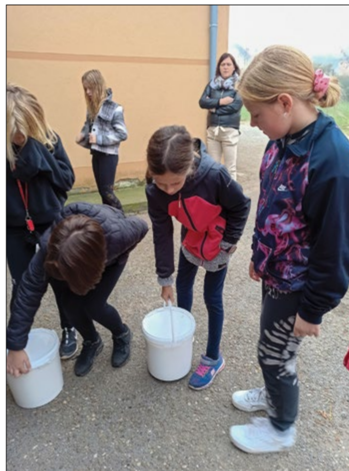
K Vogrinčevim v Skorbo po mleko. Le zakaj ...