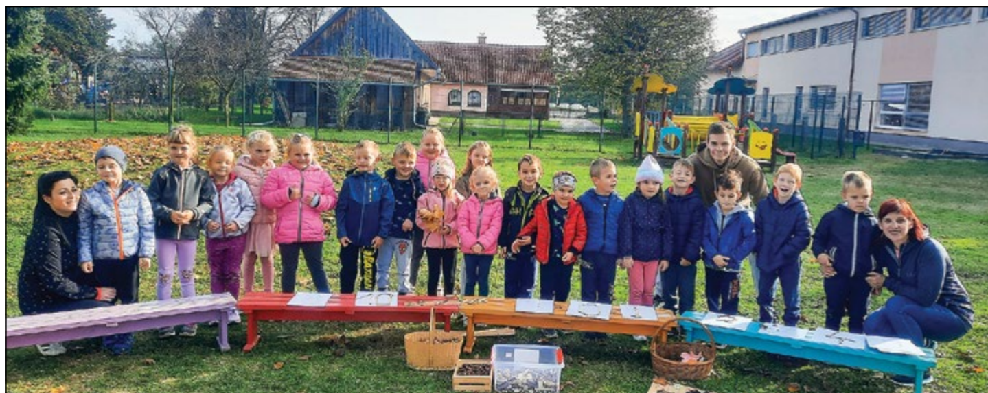
Dejavnosti v naravi so še bolj zanimive, zato radi izkoristimo vse, kar nam narava ponuja. Otroci rdeče igralnice so se tako v naravi seznanjali tudi z matematičnimi izzivi.