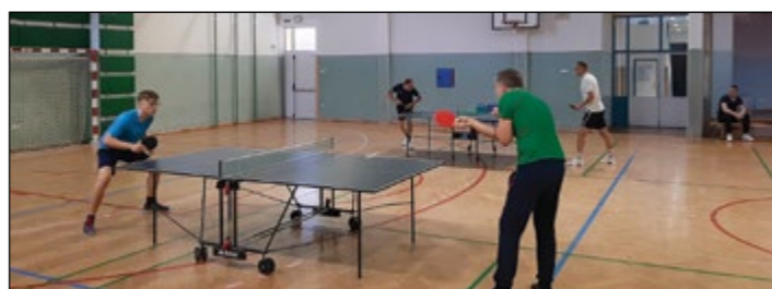
Utrinek s tekmovanja