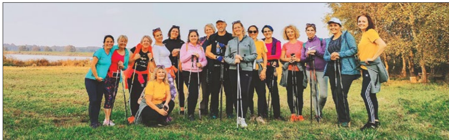
V okviru promocije zdravja se je nekaj zaposlenih iz šole in vrtca odpravila na popoldanski pohod okoli Sestrškega jezera.