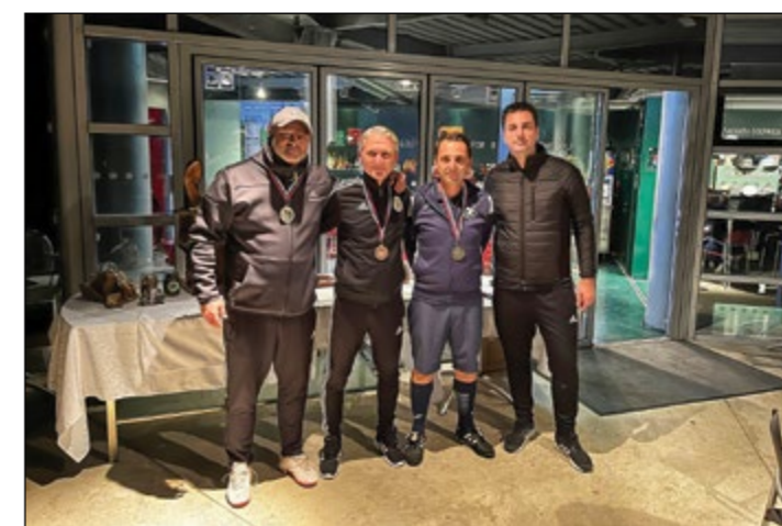
Tretje mesto ekipno – Hajdina