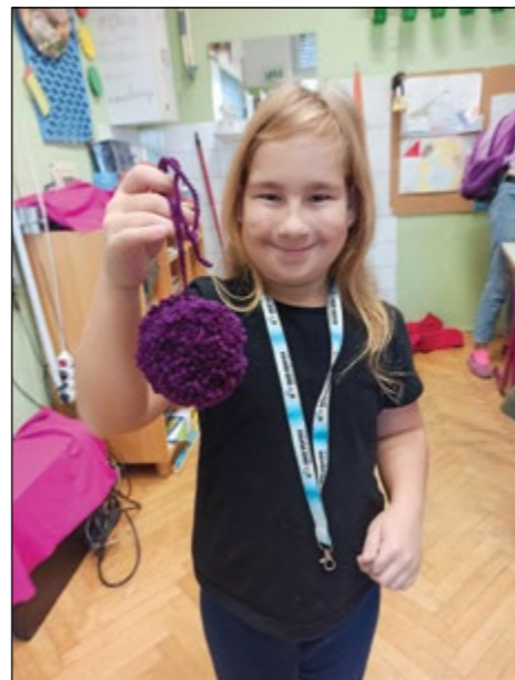
Cofek, ki je nastal pri krožku Spretni prsti.