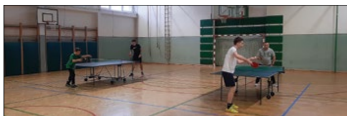
Utrinek s tekmovanja