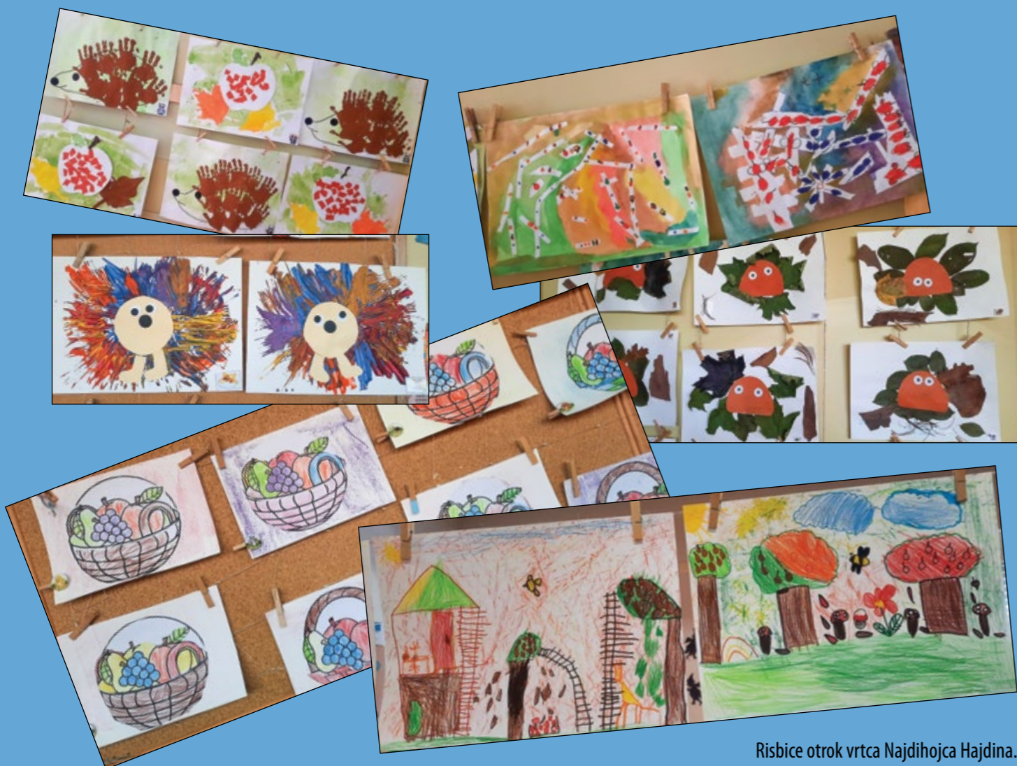
Risbice otrok vrtca Najdihojca Hajdina.