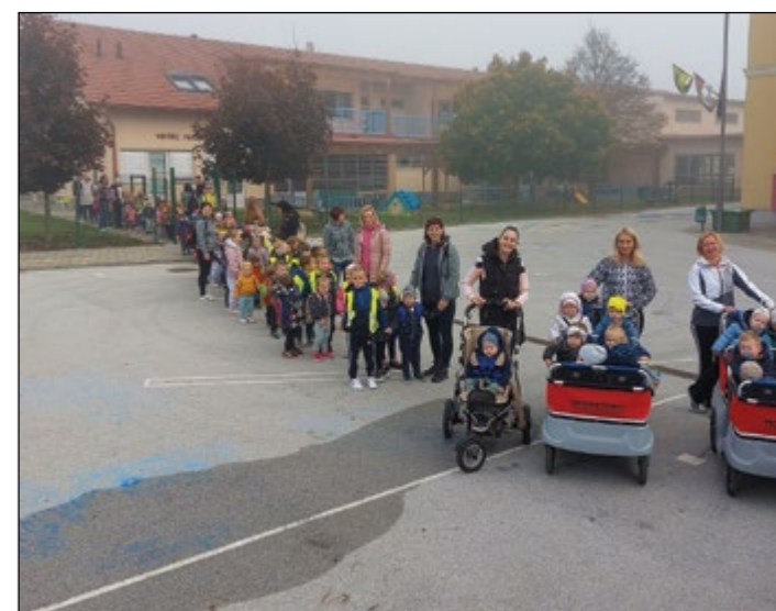
Ob svetovnem dnevu hoje smo izpraznili vrtec in se v meglenem dopoldnevu vsi skupaj odpravili na sprehod v okolico šole.