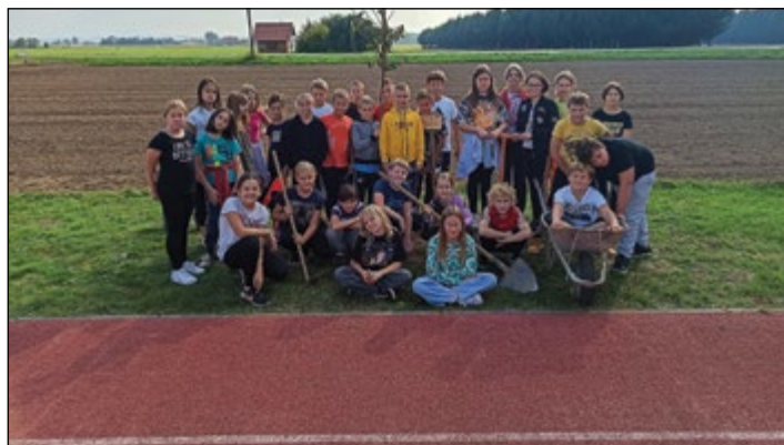
Petošolci ob svojem drevesu