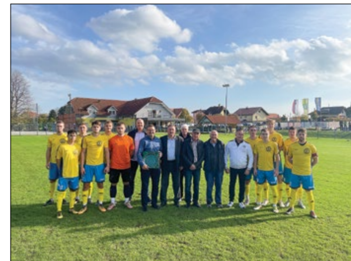
Posnetek gostov nedeljske tekme ob grbu ŠD Hajdina, ki ga društvo z nekaj manjšimi dopolnitvami uporablja že od leta 1976.