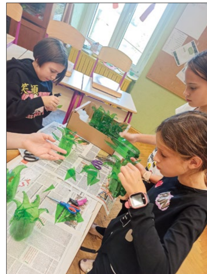
Merimo, režemo, lepimo ...