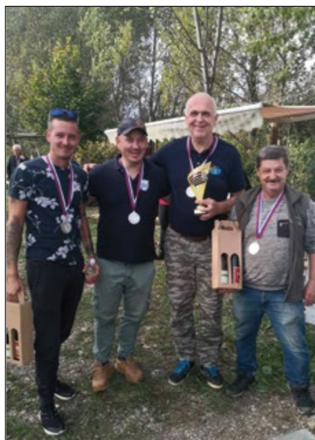
Ekipa Krivolovci Gerečja vas je bila na turnirju druga.