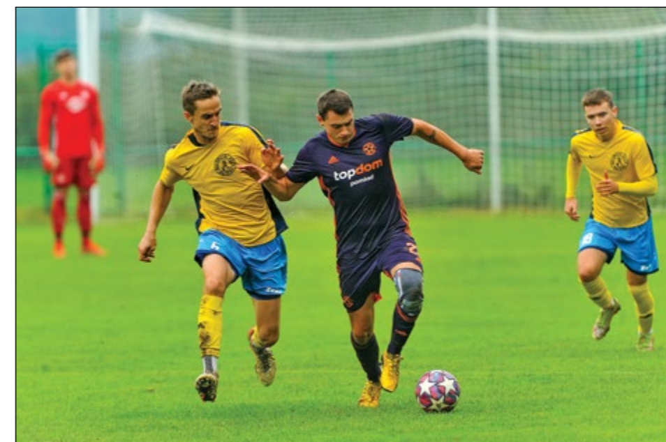
Nogometaši Skorbe so nekoliko slabše končali jesenski del sezone, zato bodo prezimovali na 3. mestu 1. lige MNZ Ptuj.

Omenjena kluba sta po jesenskem delu sezone 2022/23 tik pod vrhom najmočnejšega tekmovanja MNZ Ptuj, Superlige. Hajdina je pod vodstvom trenerja Mitja Tropa odlično začela sezono in v uvodnih štirih krogih osvojila 10 točk. Nadaljevanje je bilo nekoliko manj blesteče, kljub temu pa so Hajdinčani zadržali stik z