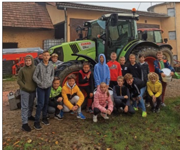
Fante 5. razredov še vedno zelo pritegnejo traktorji.