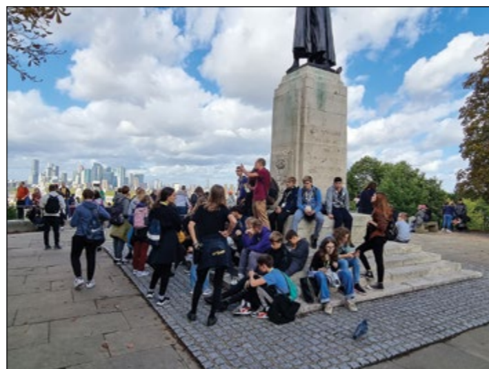
Poslušamo o londonskih znamenitostih.