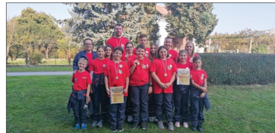
Pionirji PGD Gerečja vas so osvojili 1. mesto.