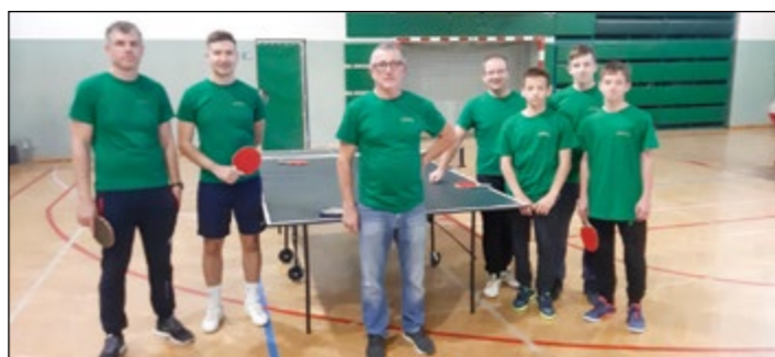
Najštevilnejša ekipa – Draženčani.