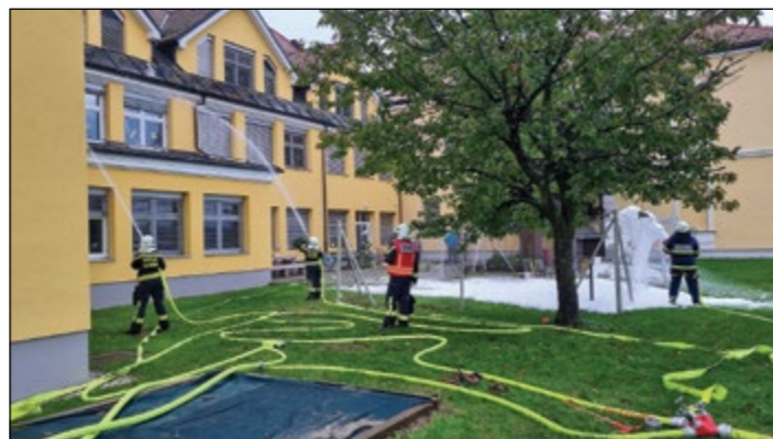
Utrinek z gasilske vaje pri OŠ Hajdina