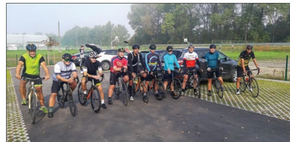
Udeleženci prvega kolesarskega kronometra občine Hajdina