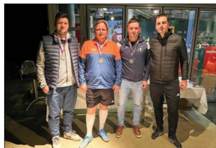
Drugo mesto ekipno – Skorba