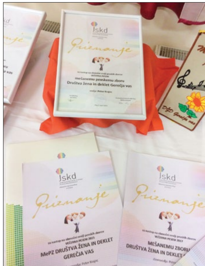
Ob praznovanju je gerečjevaški zbor pripravil razstavo Sprehod skozi zgodovino v materialni obliki.