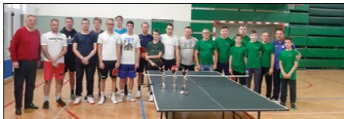
Skupinska fotografija sodelujočih na turnirju