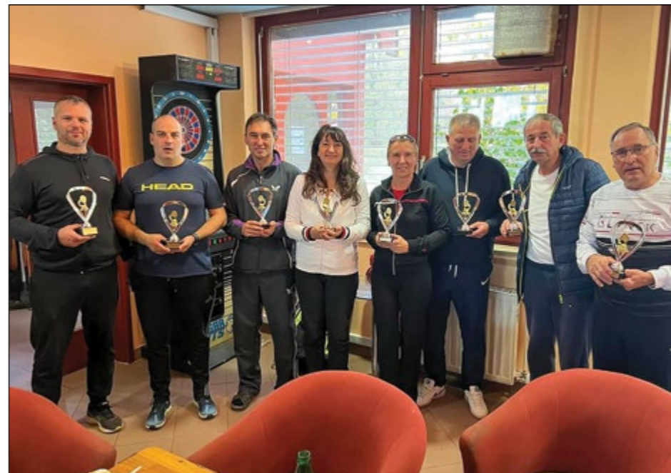
Skupinska fotografija prejemnikov pokalov v tenisu – pari

V soboto, 15. oktobra, je Tenis klub Skorba v okviru letošnjega občinskega praznika tradicionalno organiziral turnir v tenisu – pari. Turnirja se je letos udeležilo osem teniških parov, ki so prikazali več kot solidno teniško znanje.