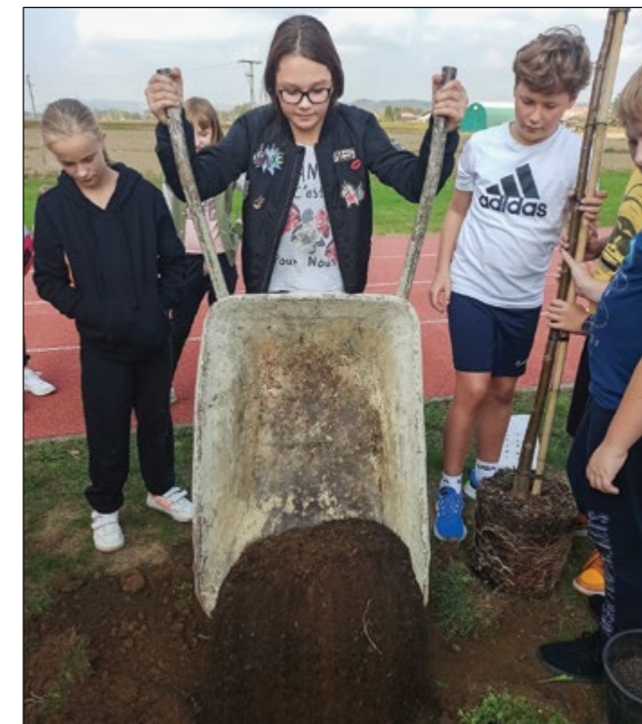
Učenje za življenje.