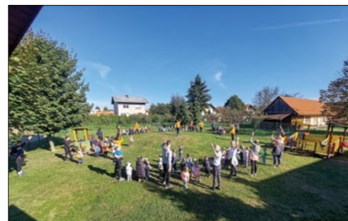
Z nami so telovadile članice Šole zdravja.