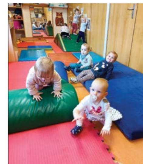
Telovadba z najmlajšimi v roza igralnici