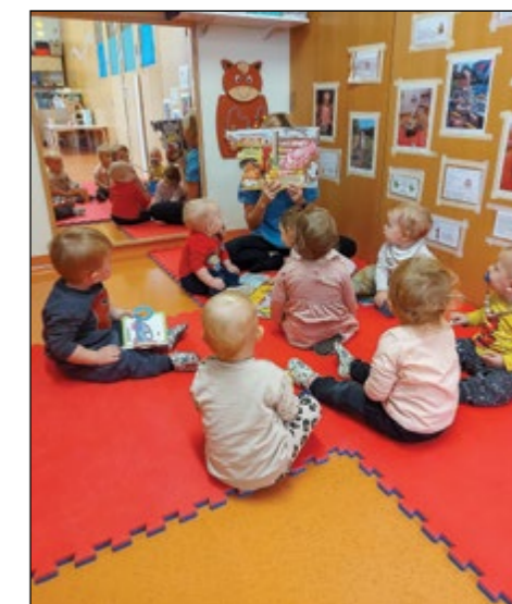
Branje pravljice ob rojstnem dnevu v roza igralnici