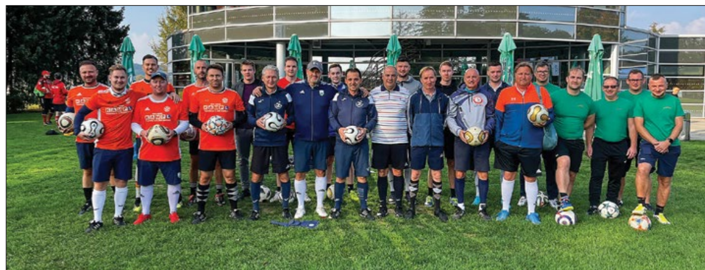
Skupinska fotografija pred dogodkom