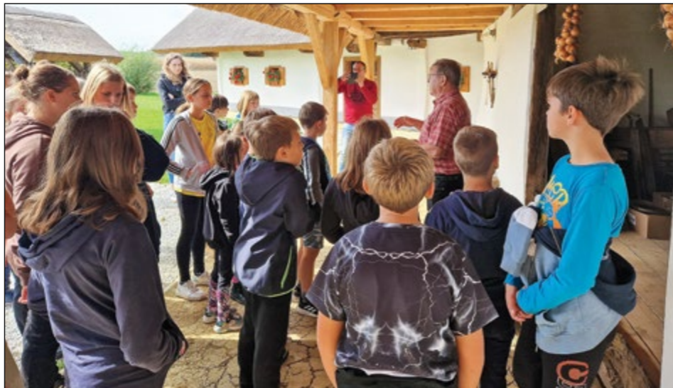
Na gasilski ekskurziji so mladi hajdoški gasilci videli in slišali veliko zanimivega.