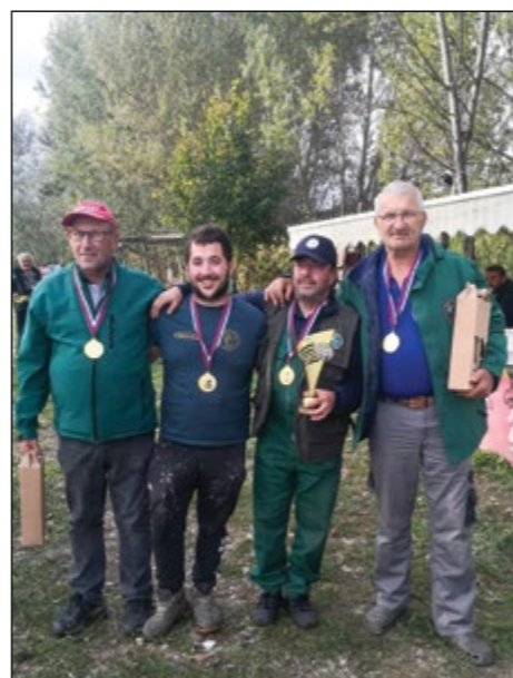
Zmagovalci – Žejne ribice Draženci