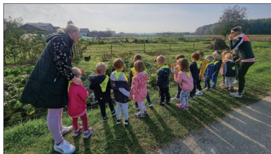
Otroci zelene igralnice med sprehodom opazujejo in spoznavajo pridelke na vrtovih in poljih.