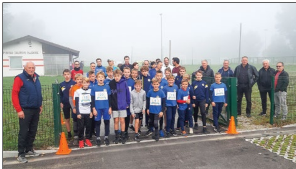
Letošnji udeleženci in podeljevalci na Hajdinski desetki