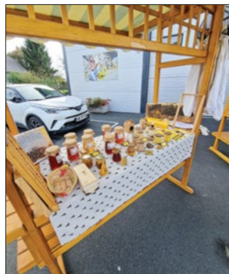
Hajdoška tržnica in prvič zelo uspešna predstavitev lokalnih ponudnikov

Besedilo in foto: Komisija za mlade Občine Hajdina