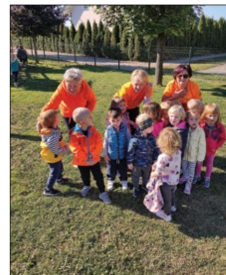
V tednu otroka so nas v vrtcu obiskale telovadke iz Šole zdravja.