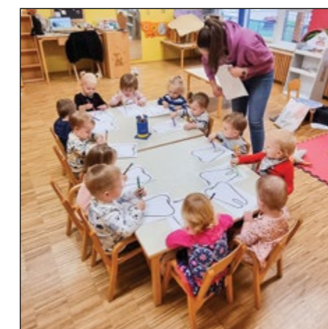
V oranžni igralnici nas je obiskala zobna asistentka in nam prikazala, kako se pravilno umivajo zobje. Za nagrado smo dobili žig in spodbudne besede, ki nam bodo pomagale pri negi zob.