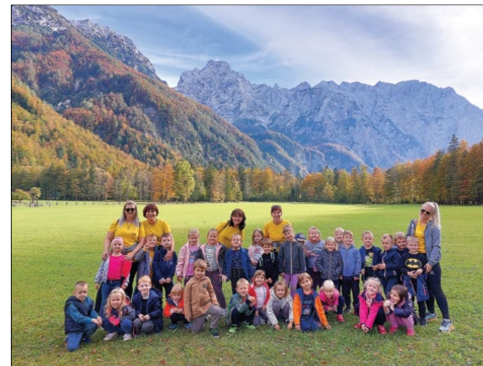
Utrinek iz lepe Logarske doline