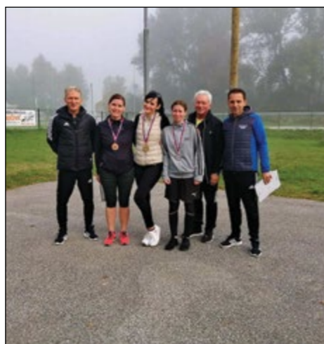
Najhitrejšje tri tekačice