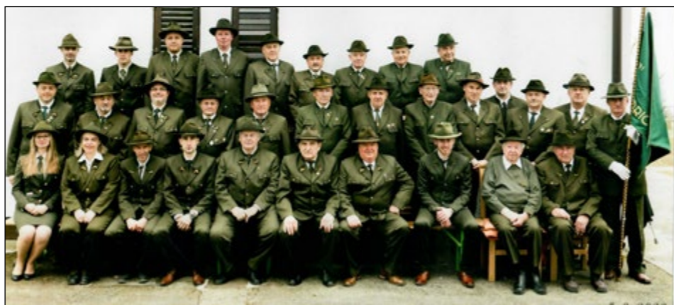
Člani lovske družine Boris Kidrič ob 70-letnici

Ta rezultat je res pohvalen, saj ni preprosto držati forme strelcev vso sezono, pravijo v LD in dodajajo, da vsako nedeljo vsi strelci niso dosegljivi, kar pomeni, da imajo širok kader dobrih strelcev. V svojih vrstah imajo tudi strelca z mednarodnim uspehom, saj je bil mladinski reprezentant Slovenije, nastopal je na evropskem in svetovnem prvenstvu. V Sloveniji še vedno velja njegov rekord 112 za-