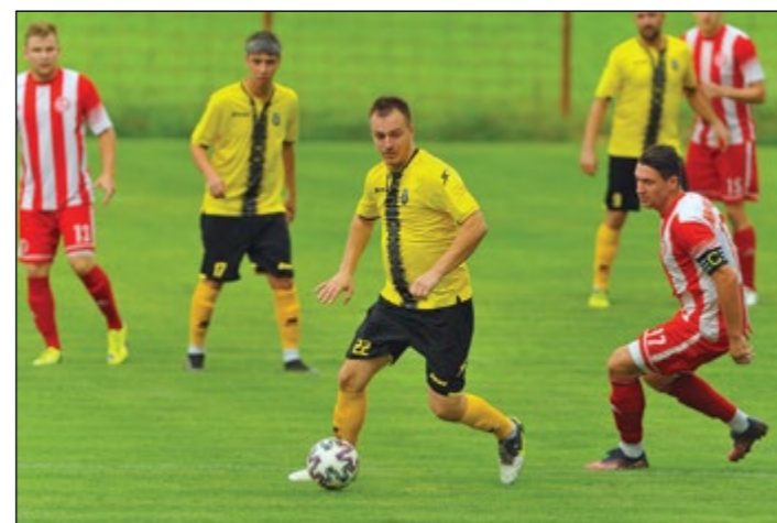
Ekipe Hajdine in Gerečje vasi v letošnji sezoni krojita vrh Superlige.