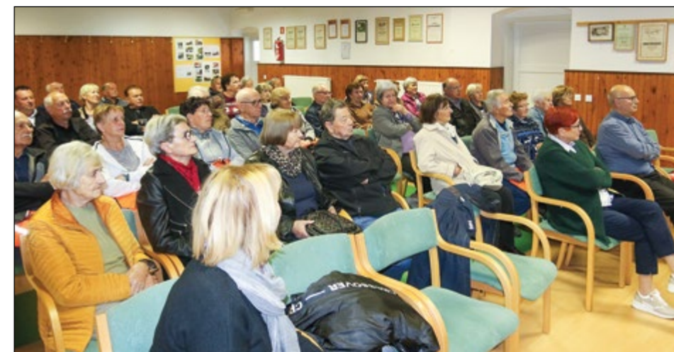
V dvorani Društva upokojeincev Hajdina se je zbralo lepo število članov, ki so prišli, da slišijo, na kaj morajo biti še posebej pozorni med vožnjo.