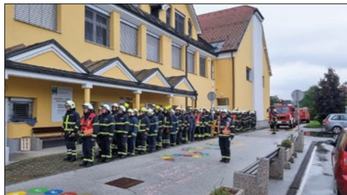
Hvaležni in ponosni smo na naše gasilce.