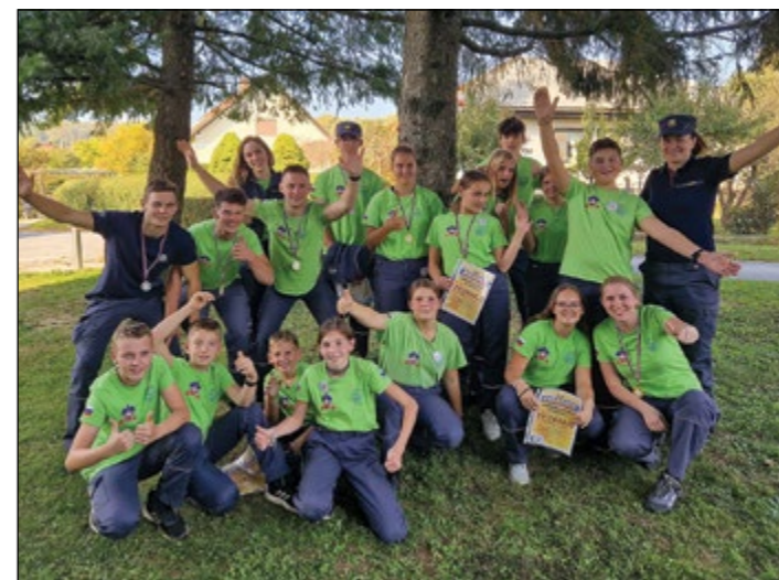
Nov uspeh za PGD Hajdoše