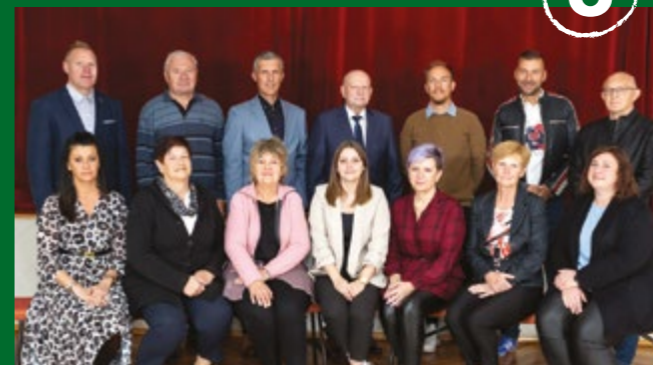
Naročnik oglasa: NEODVISNA LISTA ZA PRIHODNOST OBČINE HAJDINA

SPOŠTOVANE OBČANKE IN OBČANI OBČINE HAJDINA. PROGRAM KANDIDATA ZA ŽUPANA IN KANDIDATOV ZA OBČINSKI SVET OBČINE HAJDINA IZ VRST NEODVISNE LISTE ZA PRIHODNOST OBČINE HAJDINA, VAM BOMO V OBLIKI ZLOŽENKE POSLALI NA VAŠ DOM. UPAMO IN ŽELIMO, DA STE TUDI VI ZA SPREMEMBE.