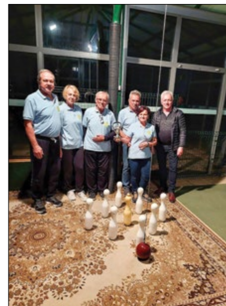
Prvo mesto ekipno – ŠD Nova Hajdina

Opomba: v vsaki ekipi je lahko nastopilo poljubno število igralcev, za uvrstitev pa so šteli rezultati najboljših