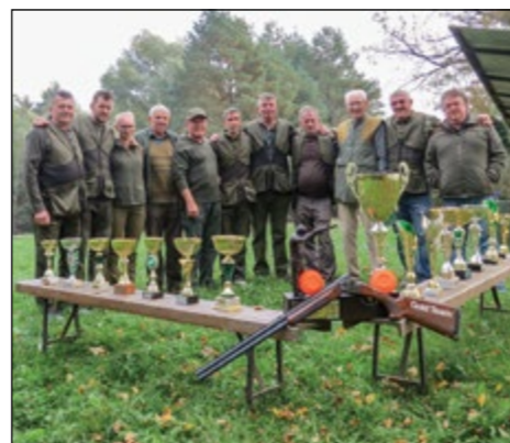
TM Strelska družina, ki je letos zabeležila kar nekaj zmag, za kar jim tudi čestitamo.

Letos so v LD nabavili tudi nov stroj za umetne golobe, želijo pa uresničiti še kar nekaj idej, med drugim v prihodnjem letu izpeljati prijateljsko tekmo Hajdina – Kidričevo z udeležbo obeh županov ter tako še bolj povezati sosednji občini in območja, kjer se razprostira lovska družina.