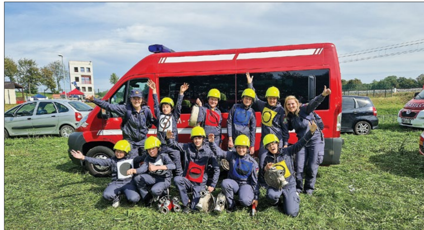
Hajdoški mladinci prvi na regijskem tekmovanju v Ormožu.

V soboto, 24. septembra, je v Ormožu potekalo regijsko tekmovanje Podravske regije 2022, kjer so svoje spretnosti in znanje pokazale ekipe pionirjev in mladincev. Pomerile so se najboljše ekipe celotne regije, ki so v svojih zvezah dosegle prva tri mesta.