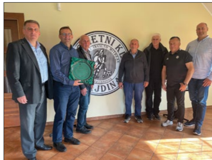
Po prevzemu priznanja NZS pa še spominski posnetek z ekipo ŠD Hajdina, ki je nekaj trenutkov kasneje začela zadnjo tekmo te sezone. Rezultat je bil 1:0 za Hajdino.