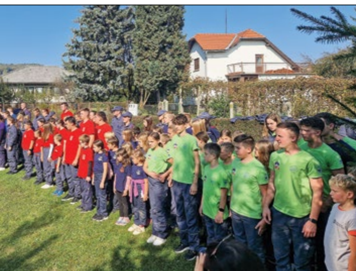
Na Ptujju je potekal letošnji kviz gasilske mladine.