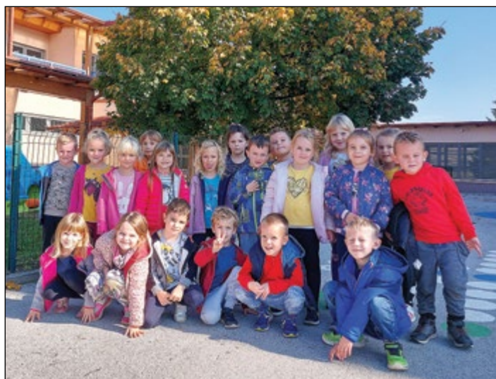
Otroci bele igralnice opazujemo drevo na igrišču vrtca.