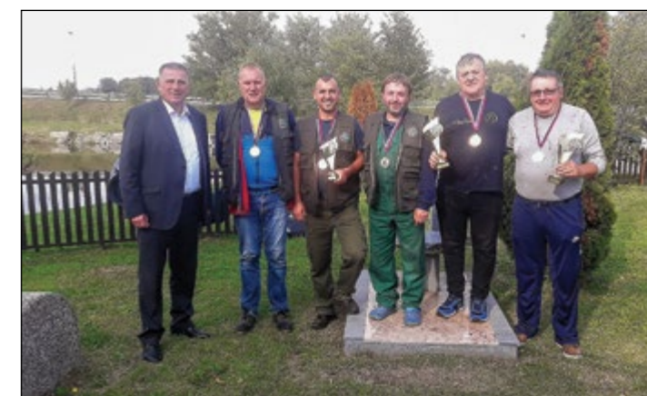
Prejemniki medalj in pokalov.