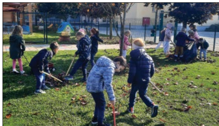
Tudi v vrtcu se lotimo jesenskih opravil. Otroci rdeče igralnice so se lotili grabljanja in pospravljanja listja na vrtčevskem dvorišču.