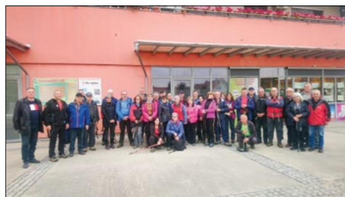
Letošnji udeleženci občinskega pohoda na Donačko goro.