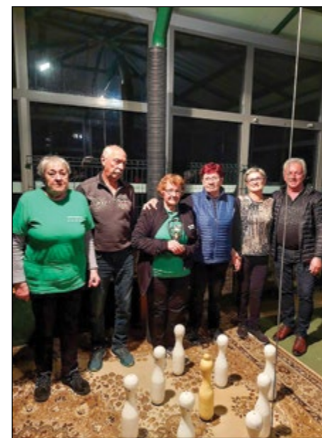
Tretje mesto ekipno – Društvo upokojencev Hajdina