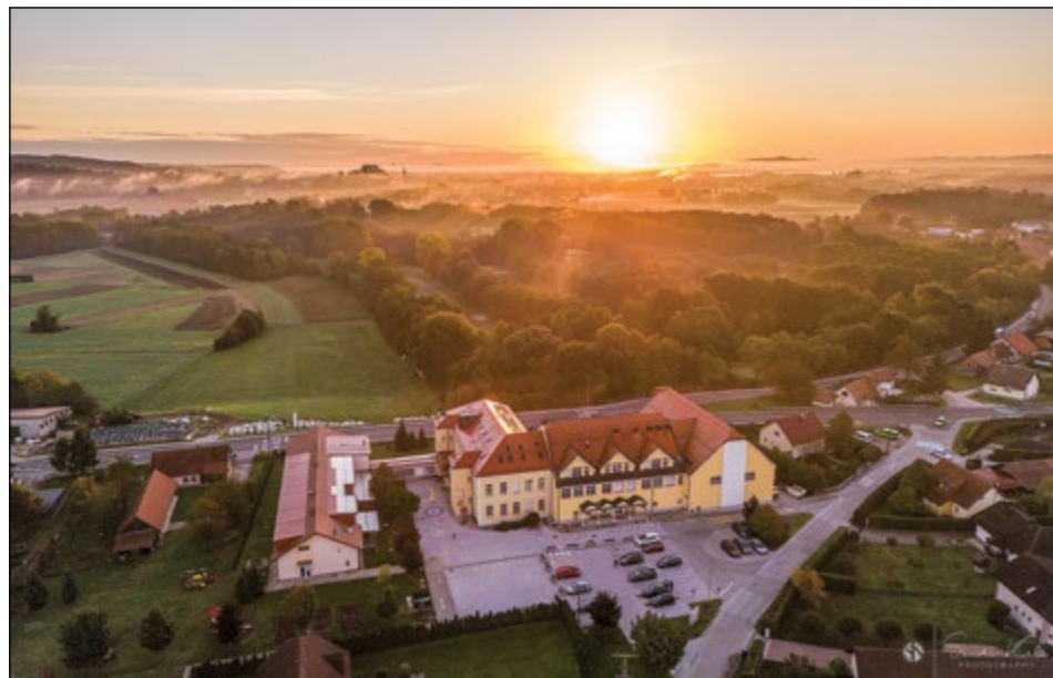
Naša lepa šola iz zraka.