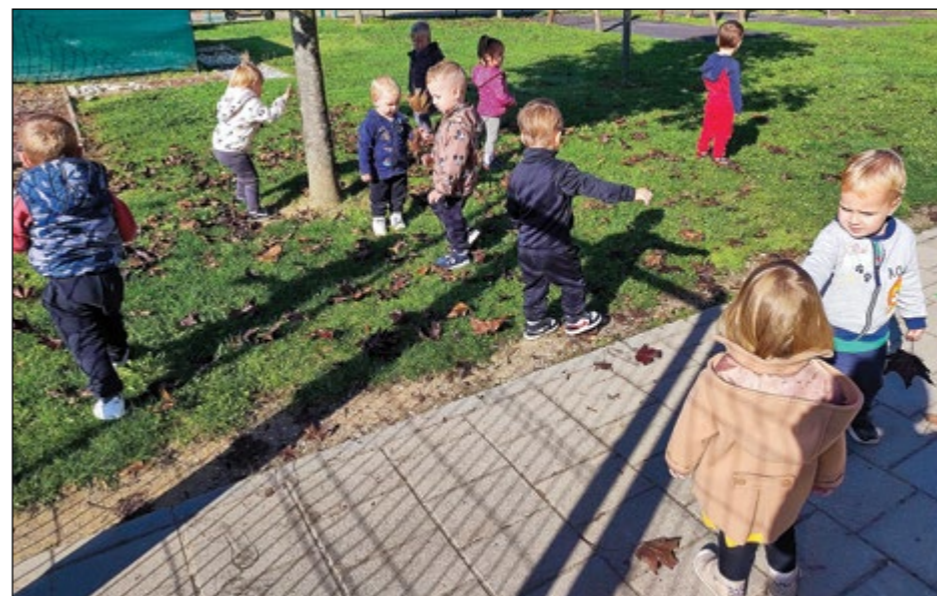
Otroci vijolične igralnice so nabirali jesensko listje, s katerim so se najprej igrali in nato še ustvarjali.