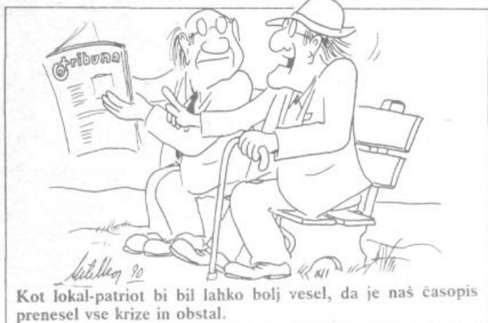
Kot lokal-patriot bi bil lahko bolj vesel, da je naš časopis prenesel vse krize in obstal.

Kje so tisti zlati časi, ko smo mahali z rdečimi knjižicami in bili ponosni, ker smo komunisti. Kako tudi ne bi. Brezskrbno in dobro smo živeli, malo delali, veliko zaslužili in tujo pamet rabili.