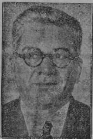
Predsednik na otoku Machada, o katerem poročamo med političnimi vestmi.