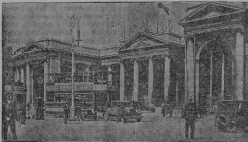
Palača kubanskega predsednika Machade, kjer je bilo ustreljenih v pouličnem boju 50 oseb, 200 pa ranjenih.