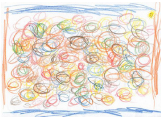
Abb. 3: Kinderzeichnung; Junge, 5,8 Jahre (Quelle: Balakrishnan, Rekonstruktion.)

Die Kinderzeichnung in Abb. 3 stammt von einem Jungen im Alter von 5,8 Jahren. Er selbst nennt die Zeichnung Muster und Künstlerbild (vgl. Balakrishnan et al, 2012). Letzteres kann vieles bedeuten. Nennen wir das in Abb.1 in Roteisenstein Geritzte nun ebenfalls ein Muster! Beide Kritzeleien verkörpern mithin eine stark ordnende Geste. Die Frage ist müßig, inwiefern sich der Sprecher (Zeichner/Ritzer) dabei in eine vorgegebene Ordnung einfügt. Eine Haltung, die den Kreis (Abb. 3) oder das Dreieck (Abb. 1) als genetisch vorgeschriebene Ordnung auffasst, muss jedenfalls dahin tendieren, die Lust an der Setzung zu verkennen. Kreis und Dreieck sind Entdeckung, werden nun aber zum Statement der Beherrschung. Dreiecke (s. Abb. 1) stehen fest und sicher, im altsteinzeitlichen Muster auch ohne Hypotenuse. Was auch immer sie hier präsentieren, - Figuren, Besitztümer, vollbrachte Handlungen, - sie werden zählbar, stehen nebeneinander, sind vergleichbar geworden und einander doch nur ähnlich. Mit nur wenigen zusätzlichen Strichen und mit der dichten Verschränkung der Dreiecke ineinander entfaltet sich ein Spiel, in dem die Dreiecke sich aufspalten und immer neue Dreiecke entstehen, bis das Spiel schließlich abreißt, weil das Muster zu einem Abschluss gekommen ist; alle Entscheidungen sind nun getroffen und die Kreation ist vollbracht.