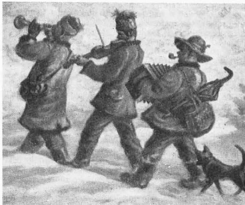
MAKSIM GASPARI - Kurenti

Kot smo pa že v začetku povedali, se ti običaji izgublajo, vendar se pa v nekaterih vaseh, kot na primer v Viskorši, zelo trudijo, da bi jih ohranili ali oživeli. Treba je vsekakor podjetnih ljudi in ki imajo veselje do domače folklore, a teh je na žalost pri nas bolj malo.