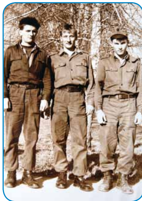
Sodački kejp, Berci prvi z lejve

»Že samo malo, za svoj tau, dve svinje mamu, kokauši, na njivi krompiče, tikvi pa kukrco mamu posajeno.