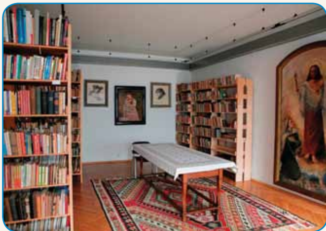
JAKOB SOKLIČ - PRVI SLOVENSKI MUZEALEC stran 3