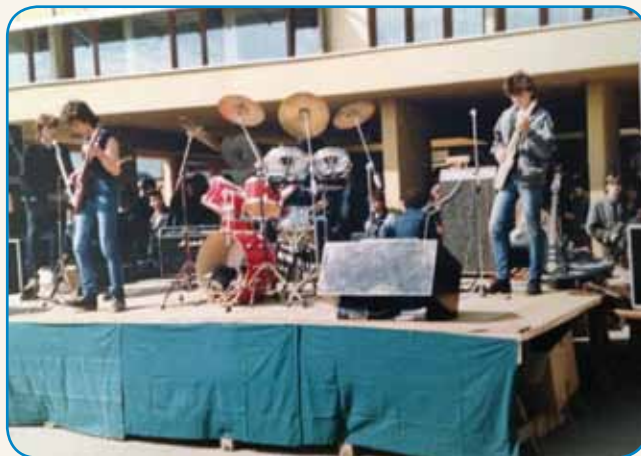
GOSLAR Z DŪŠOV IN TEJLOM stran 4