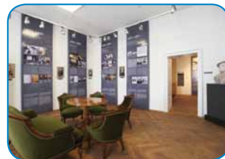
Spominska soba Huga Wolfa