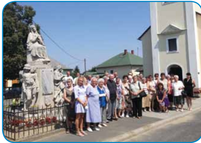
Na praznik Marije Snežne so se vaščani spominjali na svoje sovaščane, padle v prvi svetovni vojni

Pred 95. leti so postavili spomenik v Slovenski vesi tistim vaščanom, ki so življenje izgubili v prvi svetovni vojni. Bilo jih je 38.