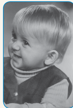
MIR JE VEČ VREJDEN stran 8