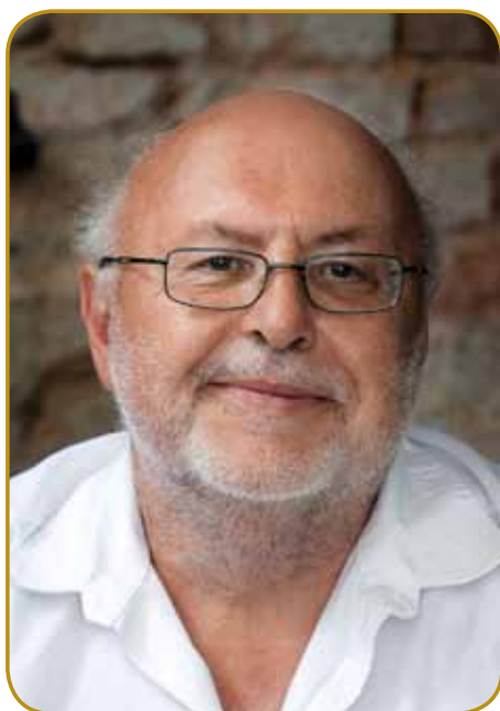
Milan Jesih je nej samo po svoji sonetaj, liki po dramaj ranč tak eričen - v nji je pripelo ekstremni modernizem

V »Antigoni« se Smole spita-va o etiki. Zavolo svoje pripovej- stvi iz mitologije je drama