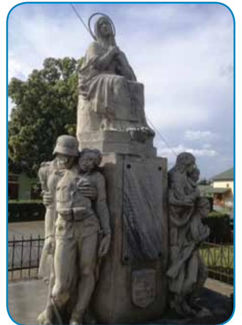
Spomenik, katerega glavni lik je B.D. Marija, so postavili leta 1923