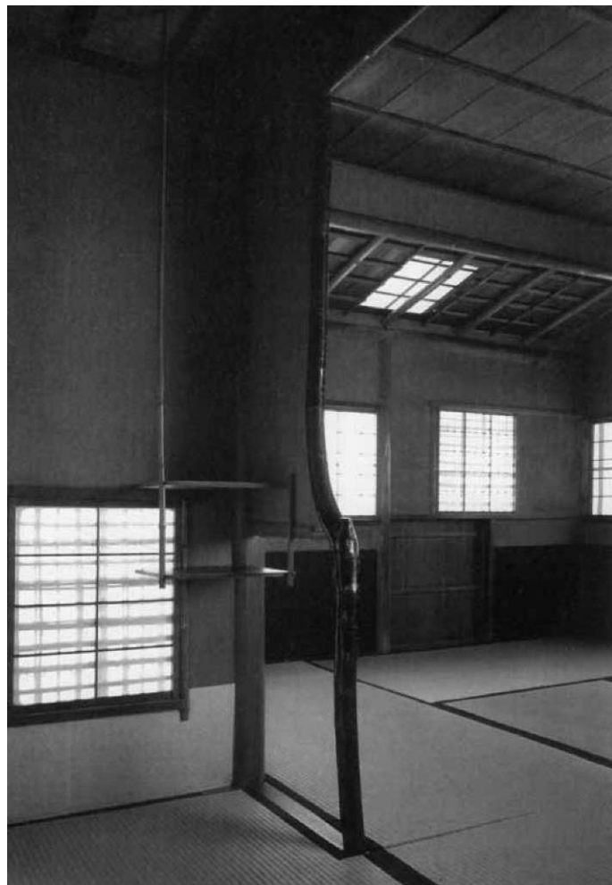
Slika 1: Pogled na svet, kjer ni edino primerne ali napačne. Naravno raščena palica pristenka (tokonome) pri tradicionalni čajni hiši.

Pomen zena in čajnega obreda za celotno japonsko umetnost Umetnost čajnega obreda - cha-no-yu je imela velik vpliv na japonski način življenja, saj je bil chajin - mojster čajnega obreda, hkrati razsodnik v umetnosti(h), ki jih zaobjema