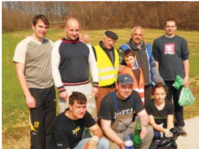
V Tešanovcih se je med čiščenjem našel tudi trenutek za fotografiranje