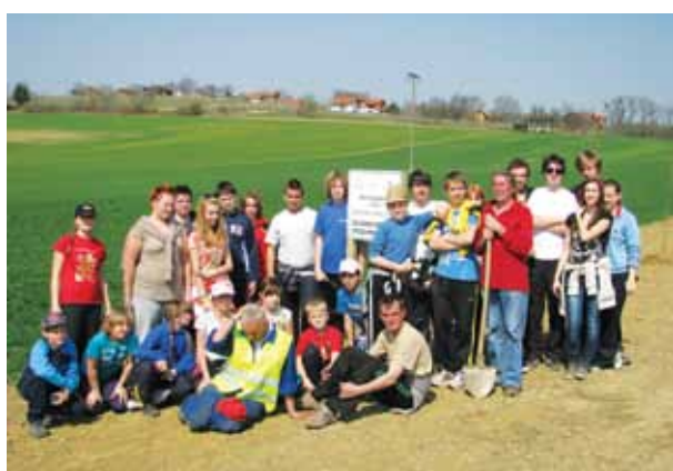
Tudi v Filovcih je bilo veliko mladih obrazov