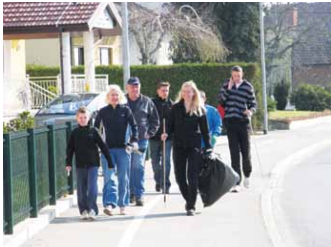
Tudi v Moravskih Toplicah se je našlo kar nekaj odpadkov

Temeljna ugotovitev letošnje globalne akcije Očistimo Slovenijo, ki je zajela tudi vseh 28 vasi občine Moravske Toplice, je nadvse spodbudna. Zbralo se je manj odpadkov kot