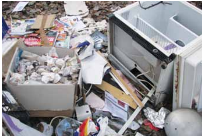
Divje odlagališče bo moral odstraniti njegov »avtor«

v lanskem letu, kar pomeni, da smo postali bolj skrbni do okolja, v katerem živimo. Pa vendar, 24. marec je na čistilno akcijo privabil kar 1155 občanov in občank vseh starosti in generacij. V akcijo so se vključila praktično vsa društva in organizacije v Občini, šole in vrtci in druge prostovoljce. Čeprav uradnih podatkov o »izplenu« akcije še nimamo, pa so nam udeleženci akcije povsod zatrjevali, da so letos nabrali precej manj odpadkov kot ob lanski akciji. Nekdanja divja odlagališča v občini so bila popisana, sanirana in urejena, iz njih je bilo v zadnjih dveh letih odstranjenih in odpeljanih na deponijo 3500 kubičnih metrov odpadkov, na nekdanjih odlagališčih pa je bilo zasajenih 200 dreves. Mlajtinsko »smetišče« se je spremenilo v nov »učni park«, ki v ničemer ne spominja na čase, ko se je tod trlo odpadkov. Podobno usodo je v akciji doživelo tudi divje odlagališče pri Filovcih: »vrli« prostovoljci so ga sanirali in zasadili mlada drevesa. Dejstvo je, da smo postali bolj pozorni in občutljivi na okolje, da nam ni vseeno, kaj se z njim dogaja. Tudi zato je nek »patek«, ki si je privoščil, da je v gozdu Keber, med Sebeborci in