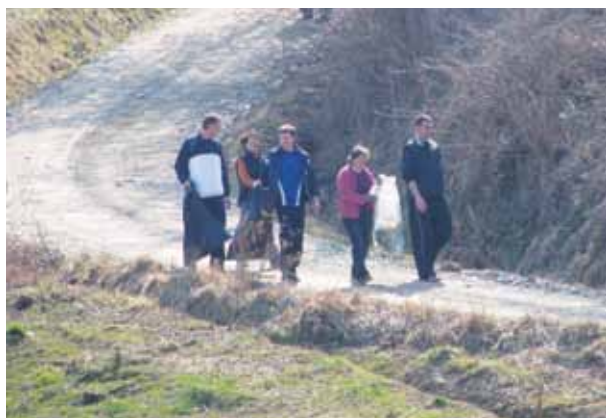
V Krncih so se čiščenja lotili z vso vneto