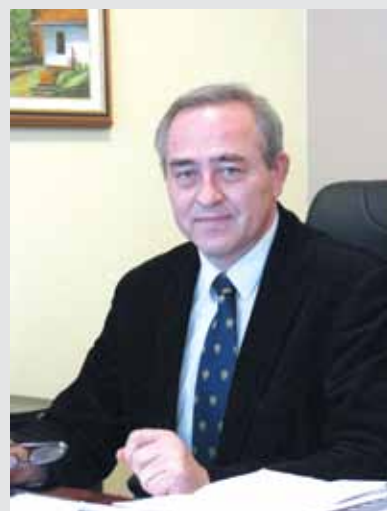
Župan Alojz Glavač