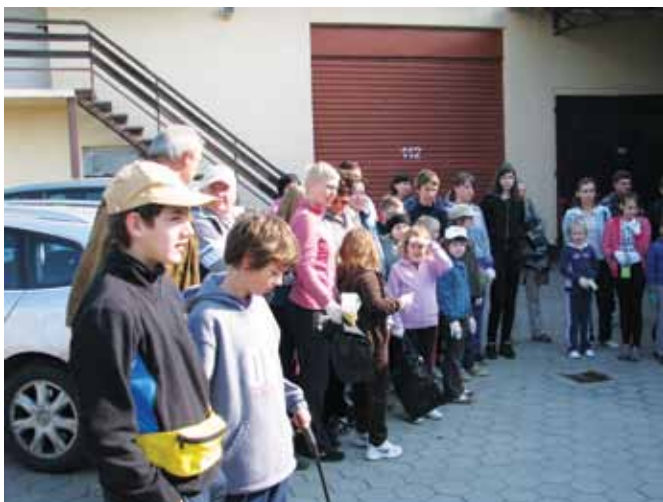
V Sebeborcih je bilo vdeti polno mladih obrazov