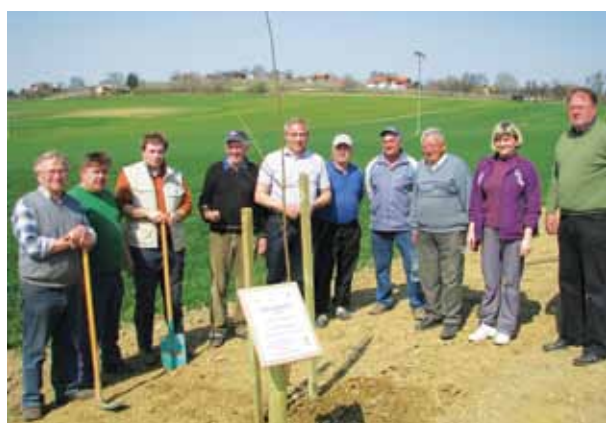
Na nekdanjem divjem odlagališču so zasadili sadike