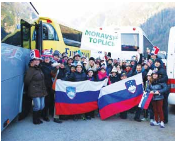
SVET KS MORAVSKE TOPLICE

Na krilih uspehov naših orlov smo se tudi krajanji Moravskih Toplic odpravili na ogled poletov v Planico. Izlet je bil namenjen predvsem druženju naših krajanov, katerega je v današnjih časih veliko premalo, za najmlajše udeležence, ki so si polete v Planici ogledali prvič, pa nov kamenček v mozaiku pri spoznavanju naše prelepe dežele. Planiška velikanka je res veličastna, vzdušje v Planici pa tudi enkratno. Navijali smo za naše letalce, seveda pa smo bili navdušeni nad vsemi, ki so se spustili po letalnici. Dan smo zaključili polni vtisov, ob misli, da se bomo naslednje leto spet udeležili poletov pod Poncami.