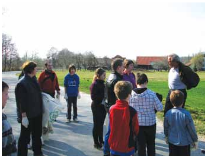
Na poti do Krncev klepet z županom