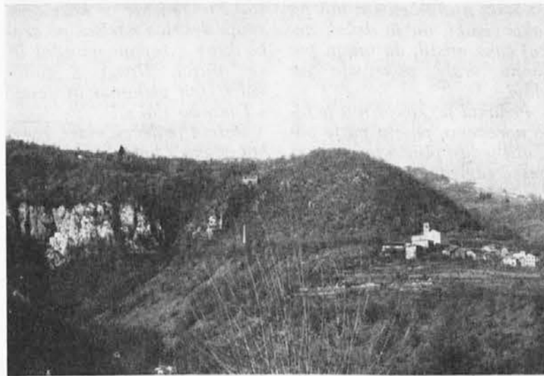
Pečina, v kateri je znamenita Landarska jama.

V HLEVU pazimo na primerno toploto, ki mora znašati povprečno 15 stopinj Celzija. Pod 11 stopinjami je prenizka, nad 18 pa previsoka. Kokoši začno ob primernem krmljenju nesti januarja ali februarja. Prashičem dajmo popoln mir, da se hitreje spijajo. Krmimo jih redno, ob določeni uri, z raznovrstno hrano. S snago preprečujemo, da ne bo živina dobila slinavke in parkljevke, ki nastopata ta mesec radi.