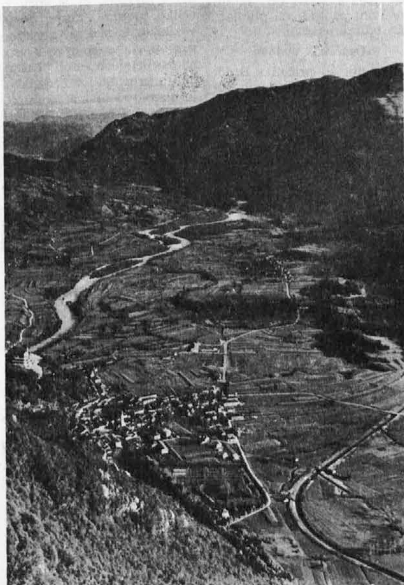
«Krasna si bistra hči planin, brdka v prirodni si lepoti» je zapisal veliki slovenski pesnik Simon Gregorčič v svoji pesnitvi «Soči». In res, ni je lepše doline kot je Soška, ljubitelji narave nam to potrjujejo iz dneva v dan. s svojimi številnimi obiski

Tudi mi se pridružujemo splešni žalosti ob njegovi smrti in izrekamo svoje najgloblje sožalje tako njegovi družini kot uredništvu «Primorskega dnevnika».